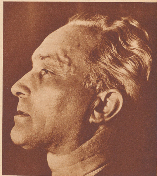
Der Schweizer Schauspieler und Rezitator Otto Bosshard

der zur Zeit mit seinen Dramen-Vortrags- abenden seine Zuhörer in den Schweizer Städten begeistert und hinreißt.