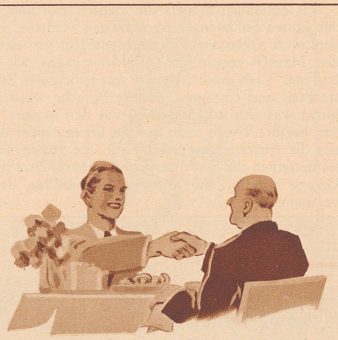
Beim Frühstück bedankt sich der Kollege sehr herzlich. Er wird jetzt Gaba auf Reisen immer mit sich führen. Gaba als Schutz vor Husten und Heiserkeit.