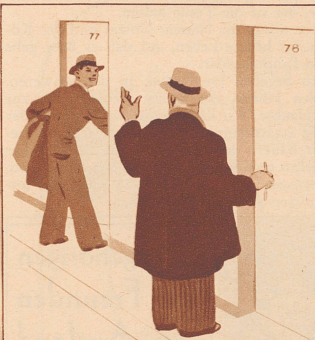
Die beiden Kollegen kommen spät abends ins Hotel und freuen sich, daß ihre Zimmer so ruhig nach hinten hinaus liegen.

An diesem neuen Problem wird jetzt gearbeitet, und es ist sehr wahrscheinlich, daß im Laufe der nächsten Jahre schädliche Bazillen, Krankheitserreger, durch Ultrakurzwellen zerstört werden können!