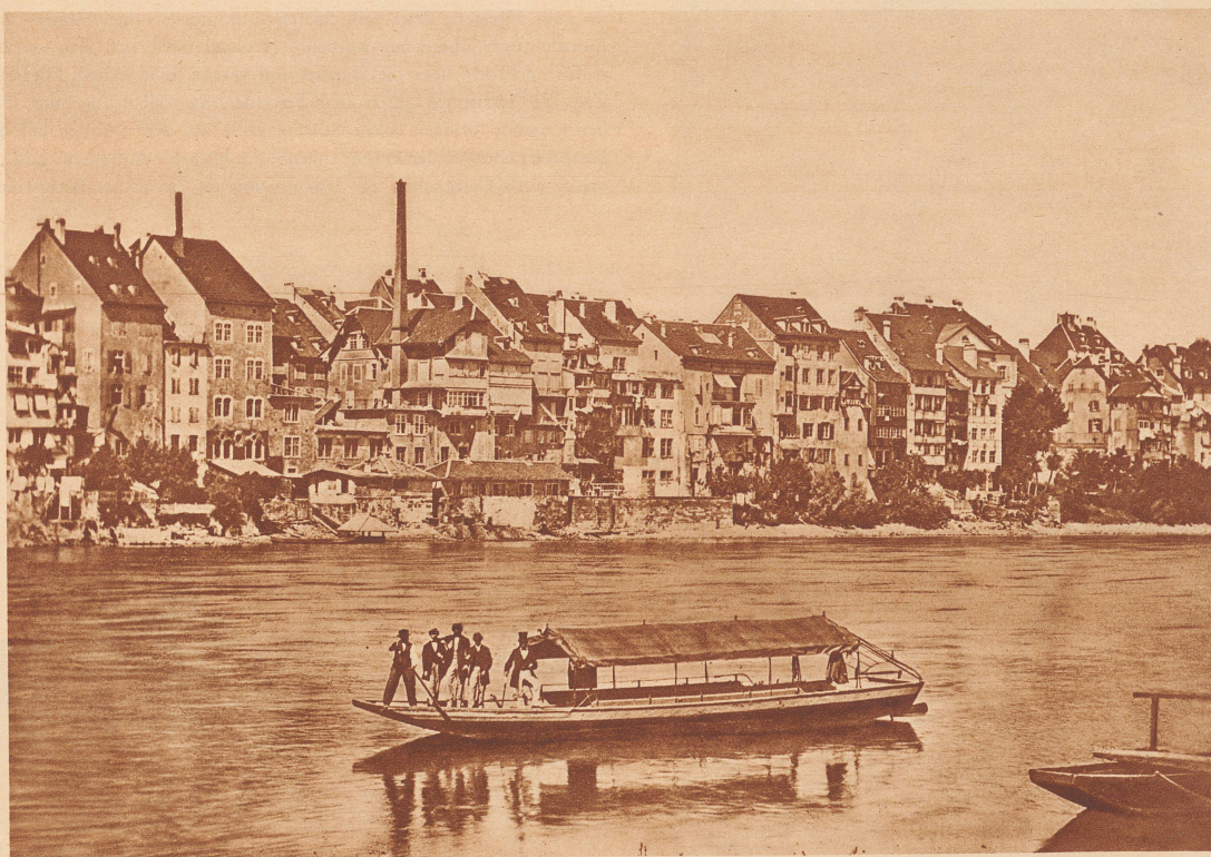
Die gute alte Zeit so um 1860. Die «Totentanzfähr» zwischen Totentanz und Kaserne. Zu dieser Zeit waren in Basel mehr als ein Dutzend Fähren im Betrieb. Heute sind alle bis auf drei von der blauen Wasserfläche des Rheins verschwunden. Bâle aux environs de 1860. Au premier plan, le bac qui passait de Totentanz à la Caserne. A cette époque, la ville comptait 20 bacs. Il n'en subsiste que trois aujourd'hui.

Es gibt wenig Orte auf der Erde von der Größe, Bedeutung und Betrieb-samkeit Basels, an denen das uralte Verkehrsmittel der Stromfähren noch erhalten ist. Fast überall sonst, wo die einst kleinen Siedlungen an so mächtigen Strömen wie der Rhein einer ist, zu Großstädten sich entwickelten, sind im Laufe des Wachstumsprozesses die Fähren durch Brücken ersetzt worden. Das entspricht durchaus der Hast und der Schnelligkeit der heutigen Epoche, denn Fähren sind bekanntlich keine sehr rasche Angelegenheit. Wer sich ihrer bedient, hat Zeit und braucht nicht zu pres-sieren. Dennoch stimmt es wohl nicht ganz, wenn einer behauptet, daß die Basler Rhein-fähren heute nur noch von einigen Ratsherrn, Kirchengängern und Markt-frauen benützt wurden. Drei Fähren sind in Basel noch im Betrieb: die St. Alban-, die Münster- und die Klingenthalfähr, nachdem vor kurzem die vierte, die Schlachthaus-fähr, der Dreirosen-brücke weichen mußte. Sie gehören gleich wie das Rathaus und das Münster zum Bilde dieser schönen Stadt, die, wie man weiß, noch al-lerhand für Romantik übrig hat.