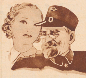
„Haben Sie nicht Angst vor Ansteckung?“ fragt sie, „Sie haben doch einen schweren Beruf“.