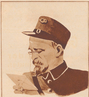
Der Briefträger ist gut Freund mit seinem ganzen Bezirk; er kennt alle und alle kennen ihn.