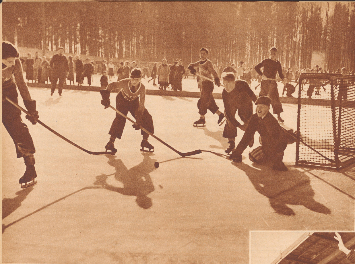
Spielmoment im Match «Hofacker» gegen «Sonnenberg».

Les enfants des écoles de Zurich disputaient le 5 février sur le patinoire du Dolder les championnats scolaires de hockey sur glace. Une partie fort disputée oppose ici les équipes «Hofacker» et «Sonnenberg», partie qui se termina par 3:1 à l'avantage des «Hofacker».