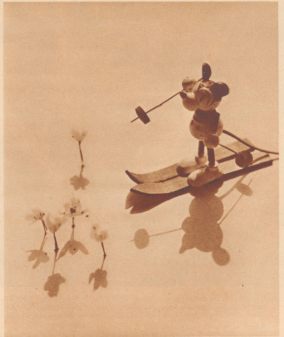
Die Blumen sagen: Halt! Der Frühling ist da!

Et sur ci affectueusement je vous quitte. Oncle Toto.