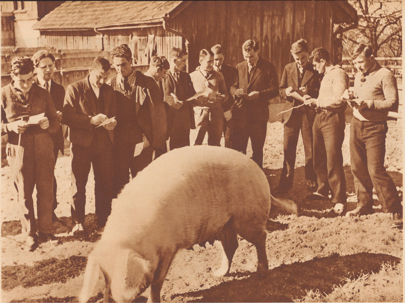
Im Examen. Examen in der landwirtschaftlichen Schule Strickhof, Zürich. Die Prüfungen erstrecken sich über sämtliche Zweige der Landwirtschaft: Ackerbau, Baumpfleger und Weinbau, Zuchtviehpflege, Milchwirtschaft usw. Es ist für das Land von großer Wichtigkeit, in der Landwirtschaft viel gut vorbereitete und mit Kenntnissen ausgerüstete Leute zu haben, die auch aus einem kleinen Heimwesen das Beste zu ziehen vermögen. Bild: Die Prüflinge beurteilen ein Zuchtschwein. Das abgegebene Urteil wird wiederum zum Urteil über sie selber. Un examen à l'Ecole d'agriculture zurichoise de Strickhof. Cet examen comporte toutes les branches de l'agriculture. Notre photo montre les candidats critiquant une truie. Comme ils jugent ... ils seront jugés!