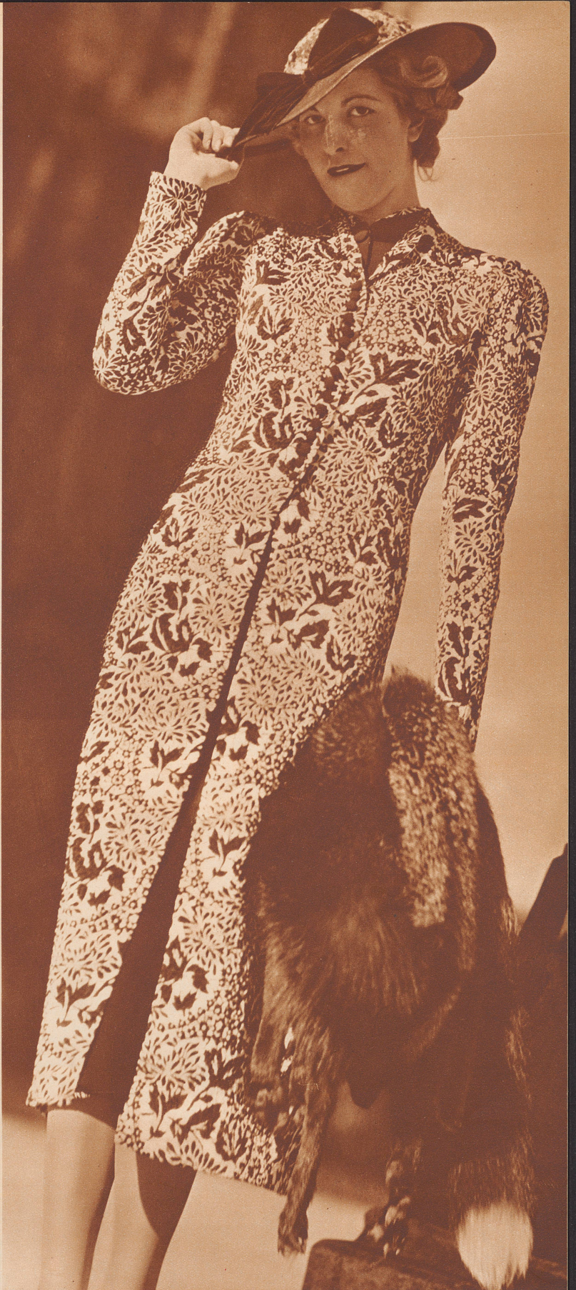
Nachmittagsmantel aus schwarz-weißem Cloqué satin, getragen über einem schwarzen Romainkleid. Modell: Farnhammer, Wien. Manteau d'après-midi en satin cloqué noir et blanc, porté sur une robe de crêpe romain noir.