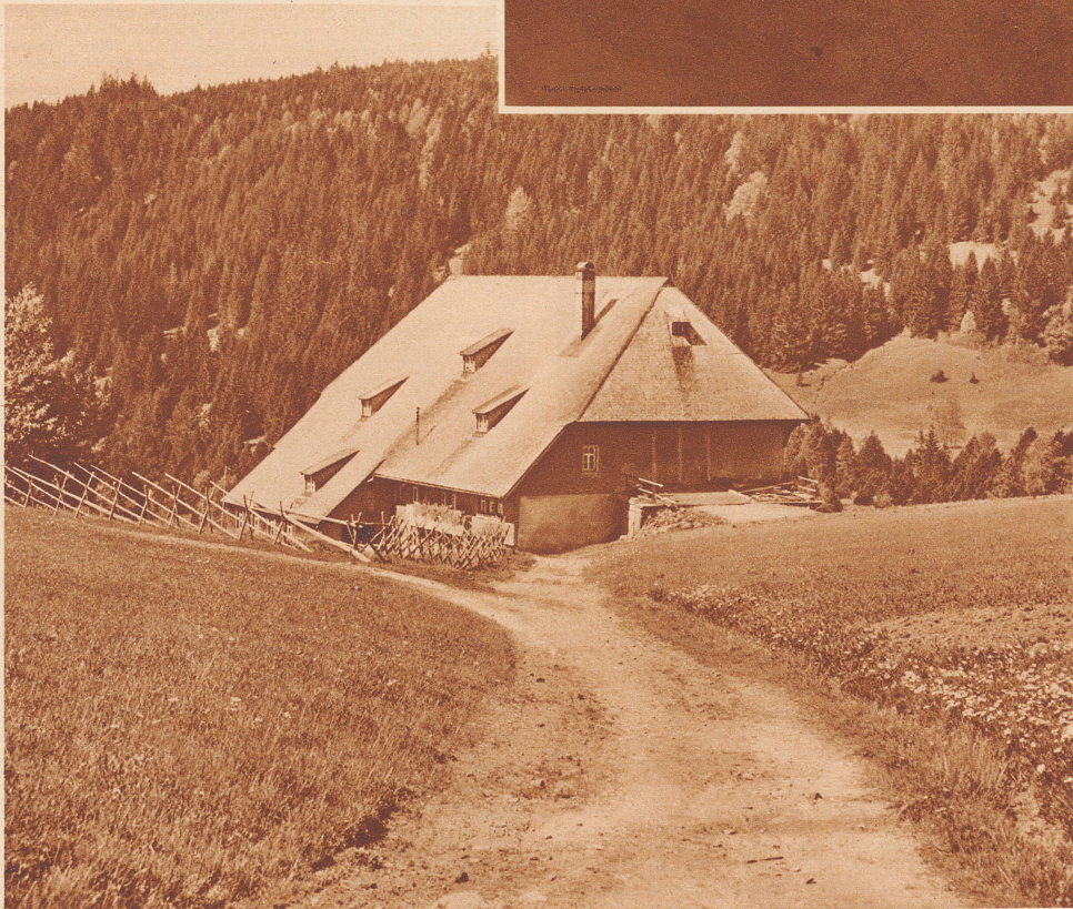
Der Furtwängler-Hof, im Volksmund «'s Furtwängle» genannt, steht mitten in der Einsamkeit eines Schwarzwaldtales. La ferme Furtwängler sise en pleine Forêt-Noire.

Hoch droben im Schwarzwald, auf der Wasserscheide zwischen Donau und Rhein, steht ein uralter Bauernhof. Weit und breit kein anderes Gehöft. Die Alemannen liebten es nicht, nahe Nachbarn zu haben. Auf diesem Hofe saß einst der «Furtwängle-Bur», ehe er wegzog