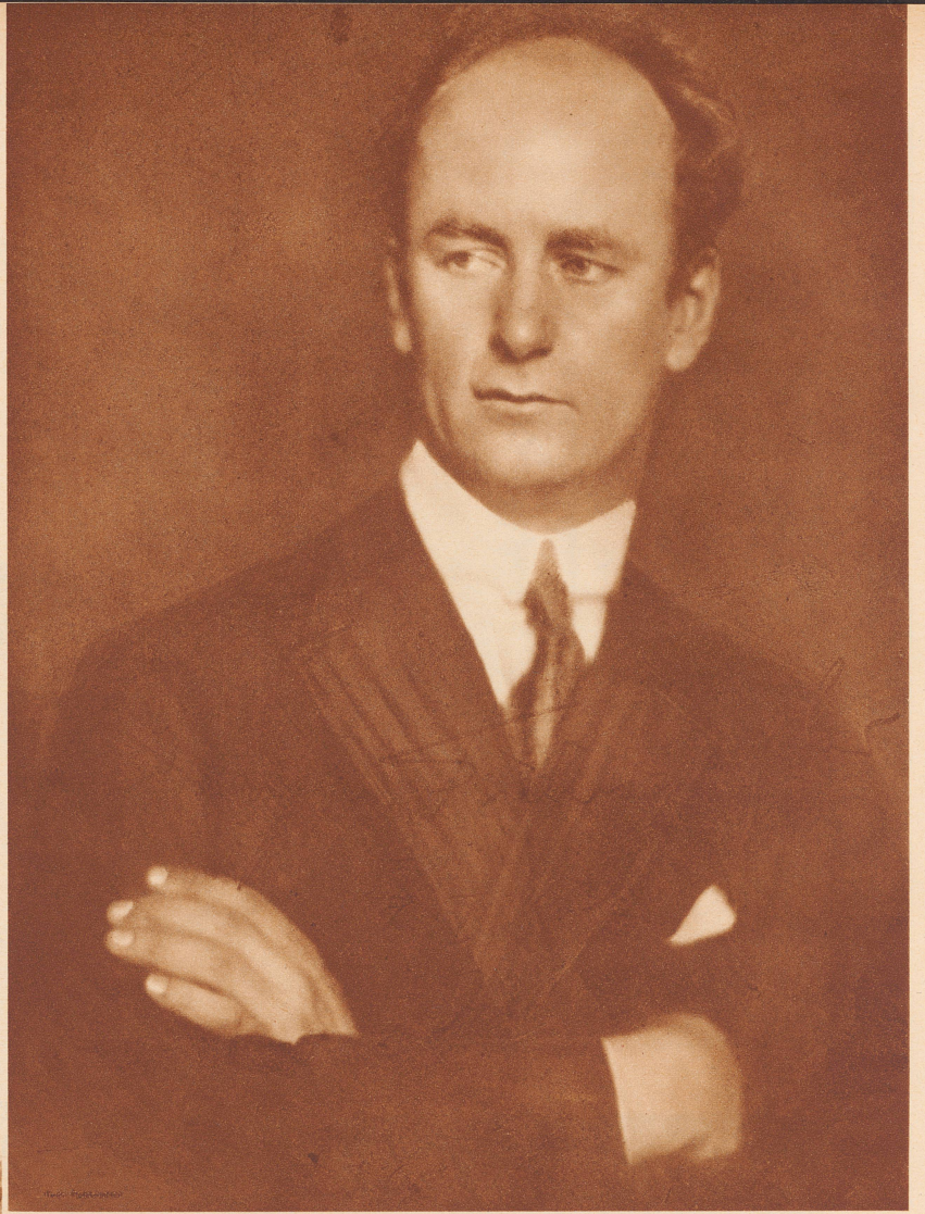
Staatsrat Dr. h. c. Wilhelm Furtwängler. Wilhelm Furtwängler en 1936.

nach Gütenbach, von wo aus er seine Schwarzwälderuhren besser auf den Markt bringen konnte. Im Schwarzwald ist manch einer Bauer und Uhrenmacher in einem, der Furtwängle-Bur aber wollte kein bloßer Uhrenmacher sein, er pröbelte und bastelte und ließ seiner Phantasie freien Lauf, bis er die Kuckucksuhr erfunden hatte, aus deren Häuschen beim Stundenschlag ein Kuckuck herausspringt und mit seinem Ruf die Zeit verkündet. Dieser Furtwängle-Bur und Kuckucksuhrenmacher ist der Vorfahr Wilhelm Furtwänglers, der sich mit seinem Dirigentenstab die musikbegeisterte Welt eroberte. Staatsrat und Dr. h. c. Wilhelm Furtwängler kommt anfangs Mai mit den Wiener Philharmonikern in die Schweiz. Sein Ruhm eilt ihm voraus.