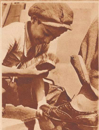
Ein Kunde hat sich eingestellt. Der kleine Schuhputzer spuckt zuerst dreimal in seine Putzbürste, bevor er die Arbeit beginnt. Crachons trois fois tout d'abord sur la brosse, puis au travail!