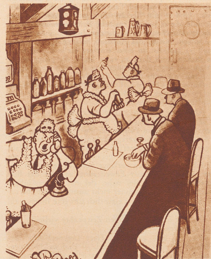
«Verflucht und zugenäht! Wenn Sie uns noch einmal die falsche Wäsche liefern, ist es aus!» — Dites donc! dites donc! attendez que je vous y reprenne! Votre employé nous a de nouveau livré une lessive qui n'est pas nôtre.

— Il y a deux ans, que je n'ai pas parlé à ma femme. — Mais pourquoi cela? — Pour ne pas l'interrompre!