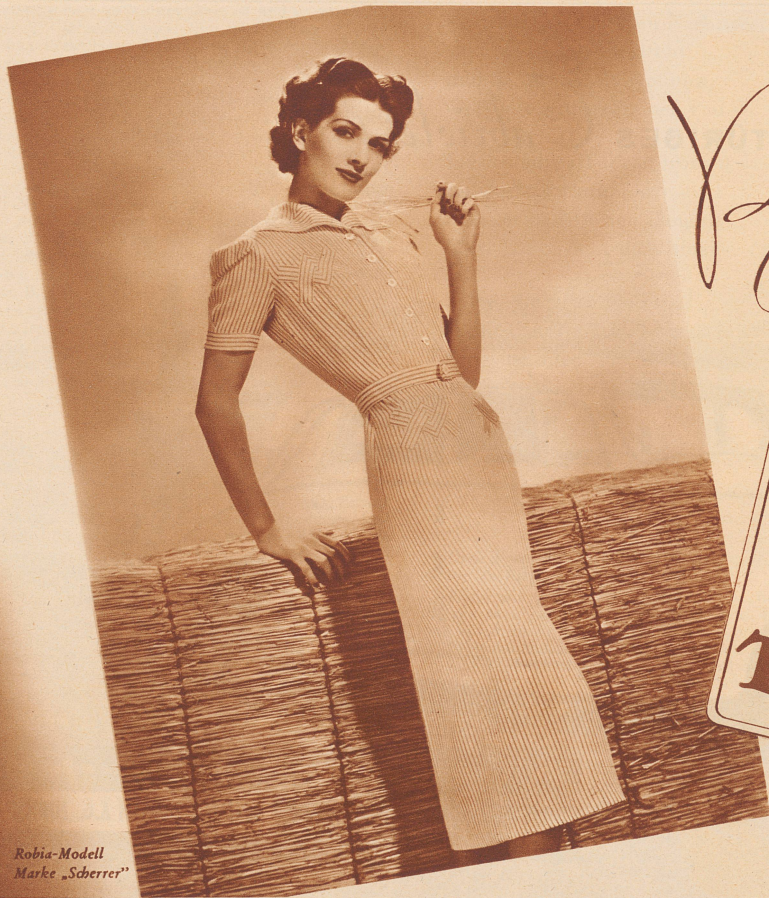
Robia-Modell Marke „Scherrer“

Lösung: Zunächst sieht es aus, als wäre der schwarze Bauer nicht mehr aufzuhalten. Weiß kann dies tatsächlich nicht verhindern, hingegen erzwingt er nach der Umwandlung des Bauers in die Dame das rettende Patt. Tb7+, Kc8 (Ka8? Tc7?), Tb5, c1 = D, Tc5+!