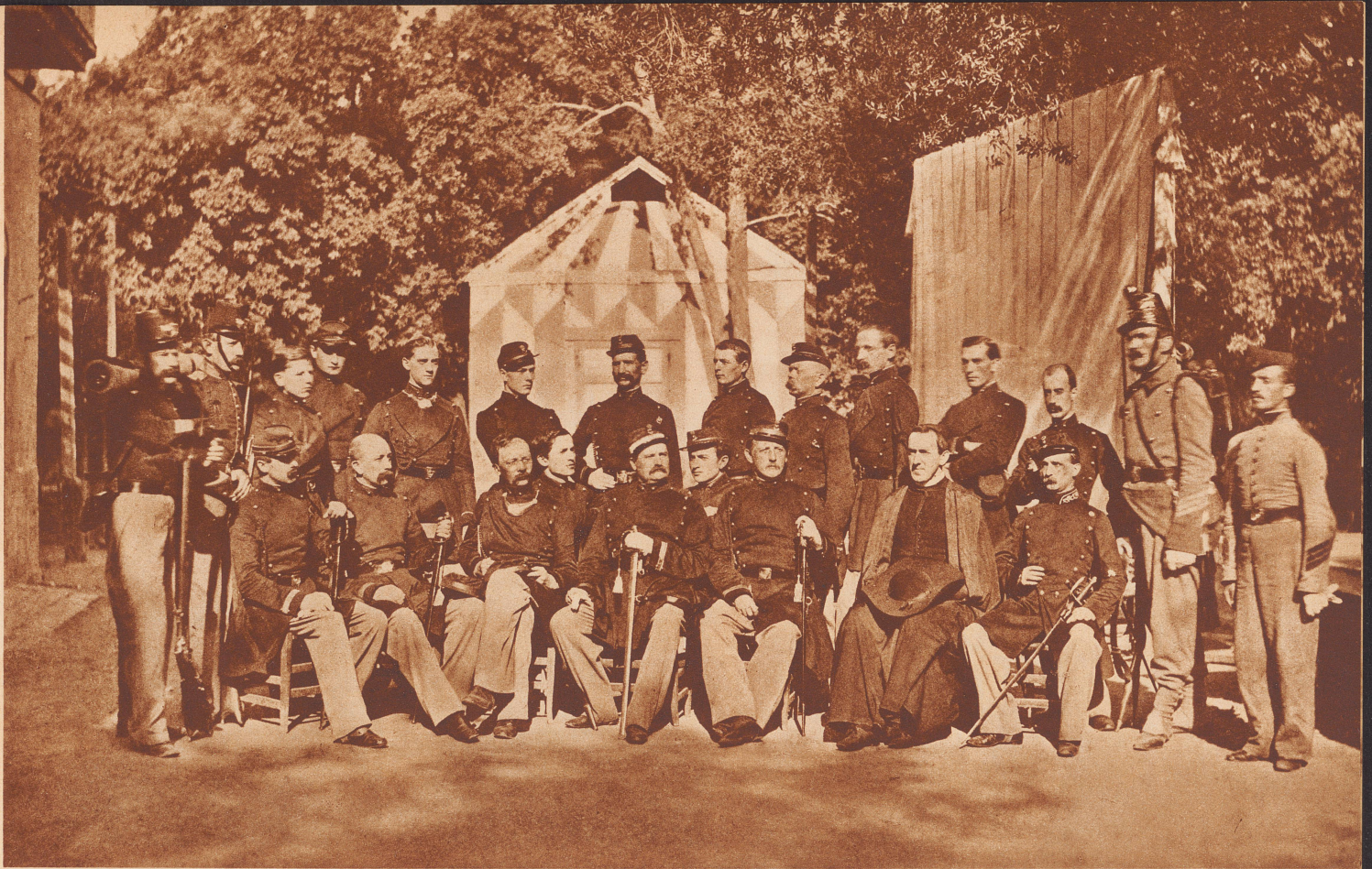
Original im Besitze der Familie von Reding, Zürich