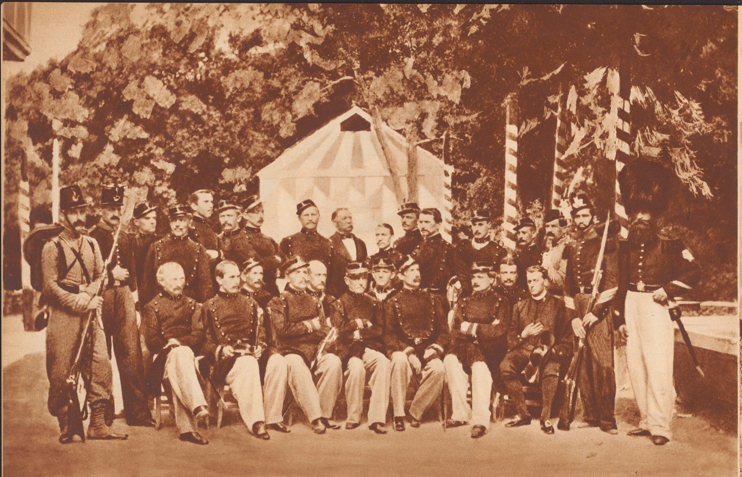
(Historisches Museum Basel)