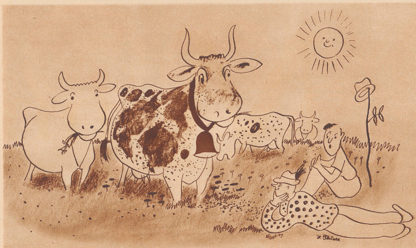
Zeichnung H. Thiele

«86 Kühe sind hier auf der Weide.» «Wie hast du denn das so rasch herausbekommen?» «Ganz einfach, ich habe die Beine gezählt und dann durch vier dividiert!!» — Il y a 86 vaches dans ce pâturage? — Comment es-tu parvenu à le dénombrer aussi rapidement? — Très simple, j'ai compté le nombre de pattes et je l'ai divisé par 4!!