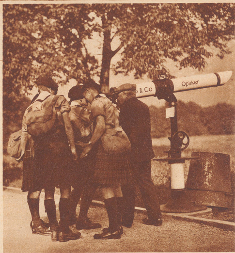
Schottische Pfadfinder in Interlaken.

... tandis que des éclaireurs écossais s'en viennent en Suisse. Les voici à Interlaken, arrêtés devant une longue-vue, qui leur découvrirra les beautés de l'Eiger, du Mönch et de la Jungfrau.