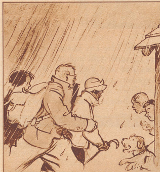
Na, für Abkühlung hat der Regen gesorgt. Der Vater seufzt: «Das gibt einen schönen Sommerschnupfen.»