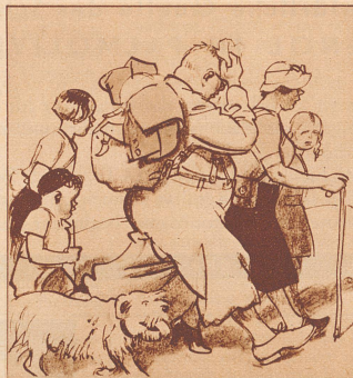
Schön heiß ist es und man freut sich auf den schattigen Wald.