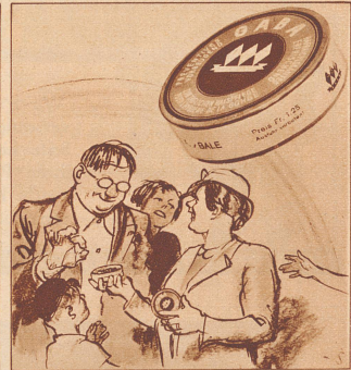
«Keine Sorge!» sagt Mutter Wäckertin, «wir haben doch Gaba mit, die gehören zur eisernen Ration. Gaba schützt vor Erkältung.»