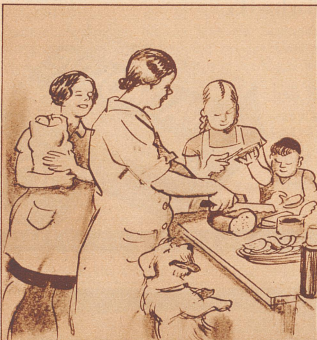
Wäckertins wollen einen Ausflug machen. Da sorgt man für den Proviant.

Süd spielt 1 Ohne Trumpf. West kommt mit Herz König heraus und Süd macht 7 Stiche gegen jede Verteidigung. Wie ist zu spielen?