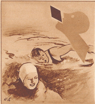
Ja, Gaba für den Hals und gegen den Husten.