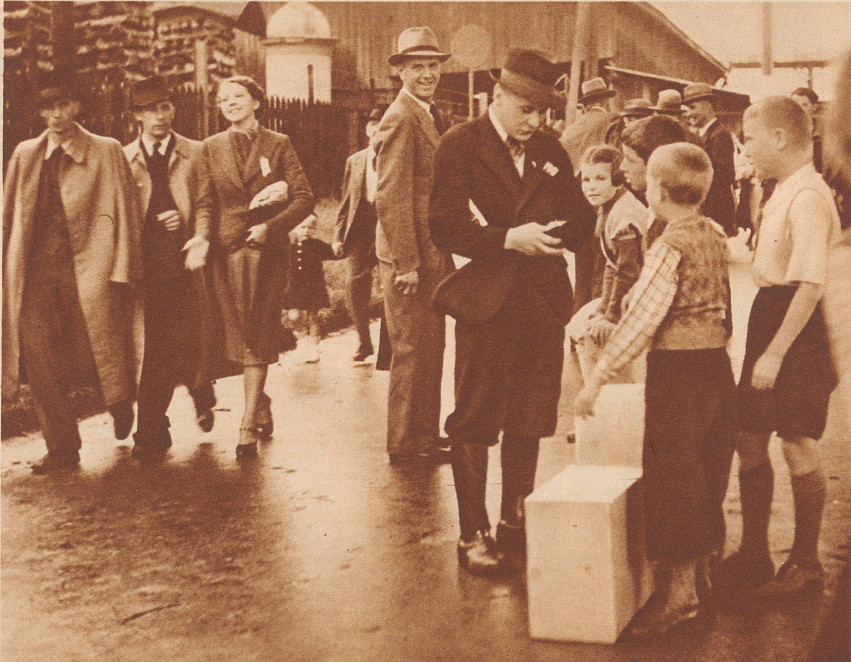
Wei'dr ou äs Chischtlü zum Zueluege? Füzg Rappe eis!

Als am zweitletzten Sonntag im August in Bern das Autorennen um den Großen Preis der Schweiz stattfand, haben Berner Buben an begeisterte Zuschauer, die gerne recht viel sehen und wenig bezahlen wollten, Teigwarenlistli verkauft. Sie haben ihre Kistli gut losgebracht; aber was sie mit den verdienten Batzen angefangen, haben sie uns nicht verraten.