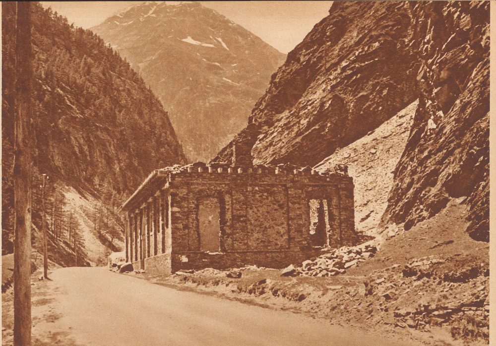
Das ist die halbverfallene Kaserne Napoleons I. an der Simplonstrasse unterhalb Gstein, am Ausgang der Gondoschlucht. Besides, Straße und Kaserne, wurde von Bonaparte ums Jahr 1805 gebaut. Im Hintergrund sehen wir das Fletschhorn.

Ein altes Histörchen heißt folgendermaßen: In einer Ortschaft brennt lichterloh ein Haus. Als eben die Ortsfeuerwehr sich ansammelt, den Flammen zuleibe zu gehen, rasseln auch die freiwilligen Feuerwehren aus der Umgegend heran, um sich an dem Rettungswerk zu beteiligen. Wütend fährt der Kommandant der Ortsfeuerwehr sie an: «Was wollt ihr hier? Da habt ihr nichts zu suchen, das ist unser Feuer!» Es dauert nicht lange, so ist eine allgemeine Prügelei im Gange. Das Haus brennt unterdessen nieder.