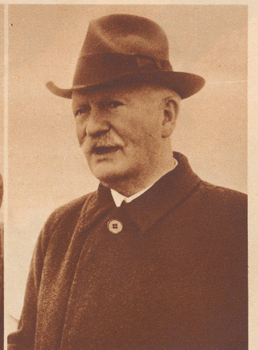
Geheimrat Karl Brandt