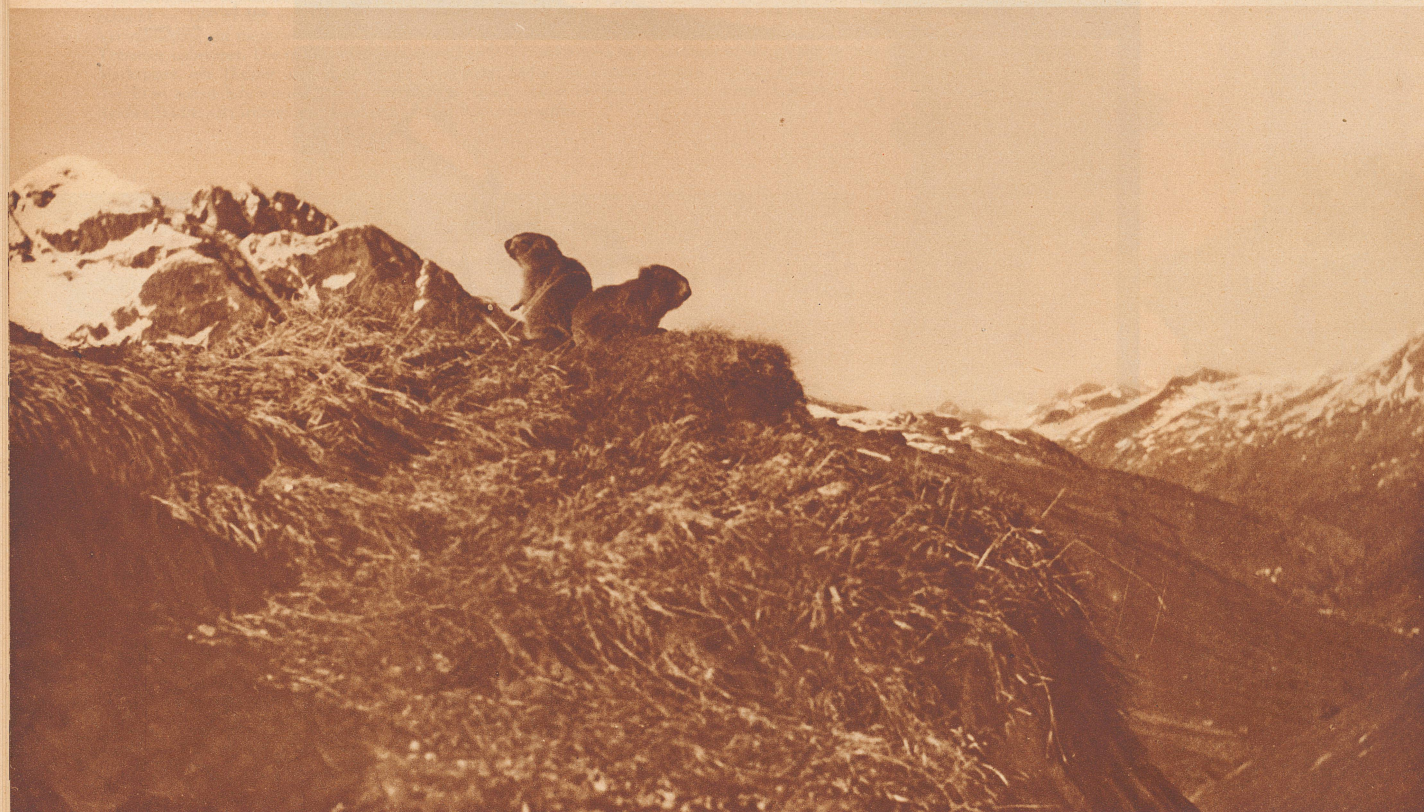
Murmeltiere vor ihrem Bau auf Fourla di Valetta bei Juf im Averser Rheintal.