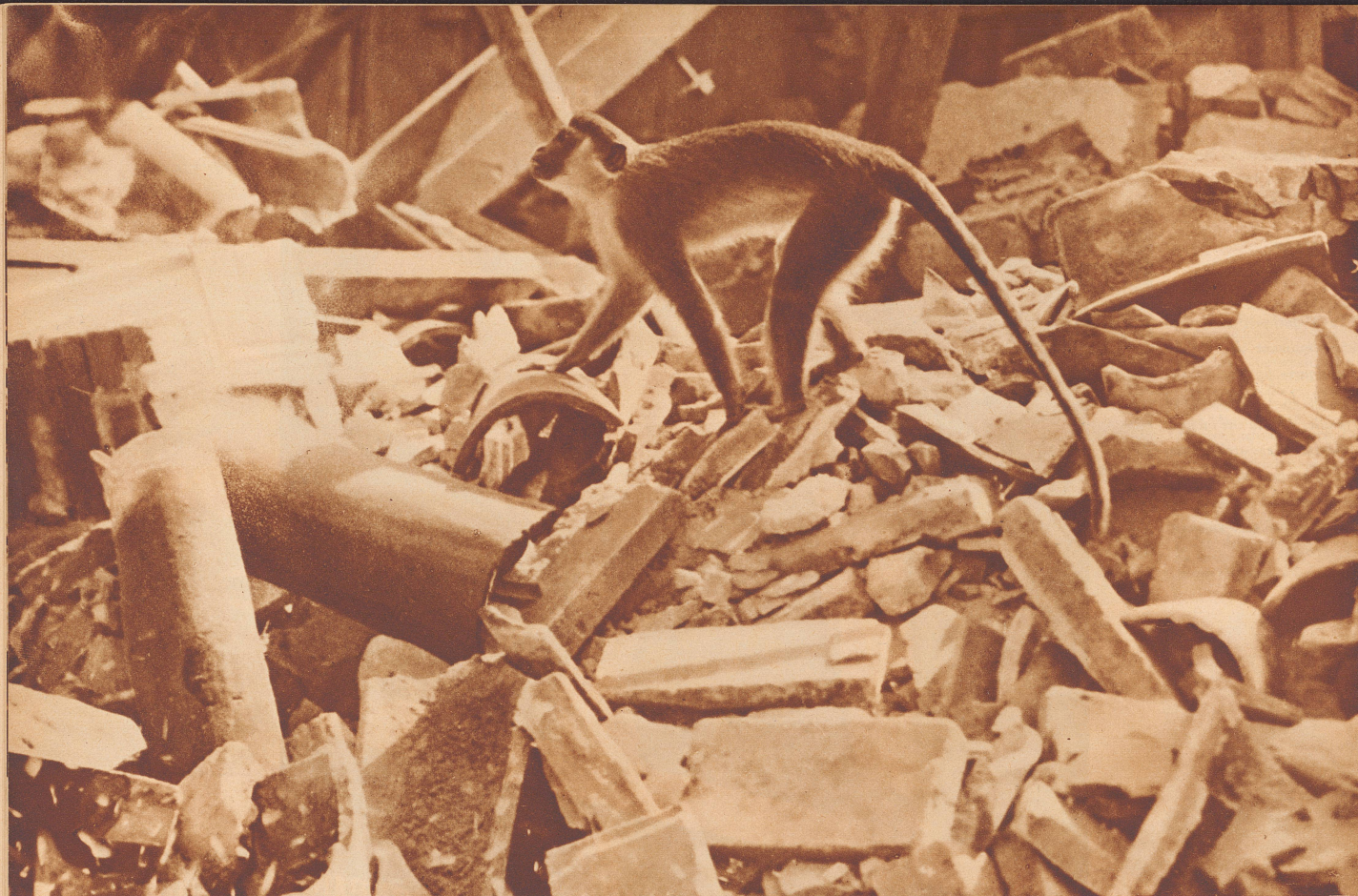
Eine Anzahl Fliegerbomben haben im Zoo von Barcelona großen Schaden angerichtet. Einige der Tiere sind den Volltreffern zum Opfer gefallen. Dieser Rhesusaffe kam mit dem Schrecken davon. Gehetzt und geängstigt sucht er auf den Trümmern des Affenhauses nach seinen Kameraden. Dans le zoo de Barcelone, ravagé par les bombes d'avion, un cercopitèque erre à la recherche de ses camarades.