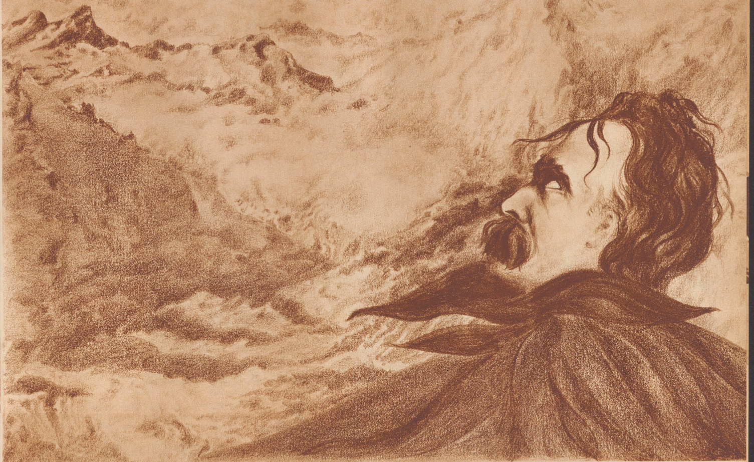
Friedrich Nietzsche in Sils. — Frédéric Nietzsche à Sils (Engadine).