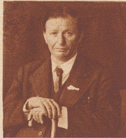
PAUL F. JOHNER †

Die schweizerischen Schachkreise vernehmen die schmerzliche Kunde vom Hinschied unseres Schweizer Meisters Paul Johner. Seit längerer Zeit leidend, hoffte er noch im Sommer dieses Jahres in einem Schweizer Kuraufenthalt Heilung zu finden; doch kaum nach Berlin zurückgekehrt, trat eine Verschlimmerung ein, von der er sich nicht mehr erholen sollte. Paul Johner hat dem edlen Schach einen großen Teil seines Lebens gewidmet und uns aus seinem Schaffen einen reichen Schatz an wertvollen Partien hinterlassen.