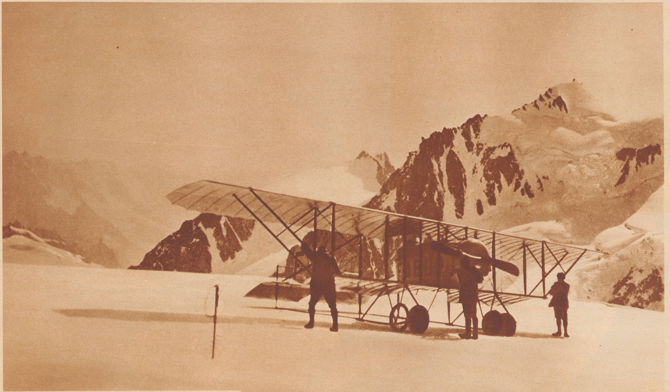
30. Juli 1921. François Durafour landete mit einem 120-PS-Caudron-Doppeldecker auf dem Montblanc. Morgens 6.05 Uhr stieg er in Lausanne auf, 1 1/2 Stunden später ging er auf einem kleinen Firnfeld unterhalb des Montblanc-Gipfels, 4330 Meter über Meer, nieder. Nach kurzem Aufenthalt startete er zum Rückflug und landete um 10 Uhr glatt in Chamonix. Durafour attire l'attention du monde entier quand, le 30 juillet 1921, il atterrit au Mont Blanc, exploit jamais encore réalisé et qui ne le fut jamais depuis.