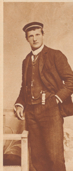
Philipp Etter, 18jährig, als Student der Städtischen Elementar- und Schul-Philipp Etter, 18 Jahre, studiert an der Elementar- und Schul-

Philipp Etter, 55me conseiller fédéral depuis 1848, est le premier Zouguis qui accède à la plus haute charge exécutive de notre pays. Né le 21 décembre 1891 à Menzingen, Philipp Etter étudia le droit à Zurich, puis, ses études terminées, s'établit à Zug comme avocat. Juge d'instruction en 1917, il était l'an suivant élu député cantonal et, à 31 ans, se voyait élire comme conseiller d'Etat. Landammann de 1927/28, il était élu au Conseil des Etats en 1930. Sa grande compétence et sa parfaite maîtrise le désignèrent comme successeur de Jean-Marie Masay quand celui-ci se retira. Le 27 mars 1934, il était élu au Conseil fédéral, dont il est encore actuellement, avec ses 47 ans, le benjamin d'âge. Au militaire, major d'infanterie. En reconnaissance des grands services qu'il rendit à la cause de l'Empire suisse et de la défense nationale « exclusive », l'Université de Neuchâtel vient de lui décerner le titre de docteur honoris causa.