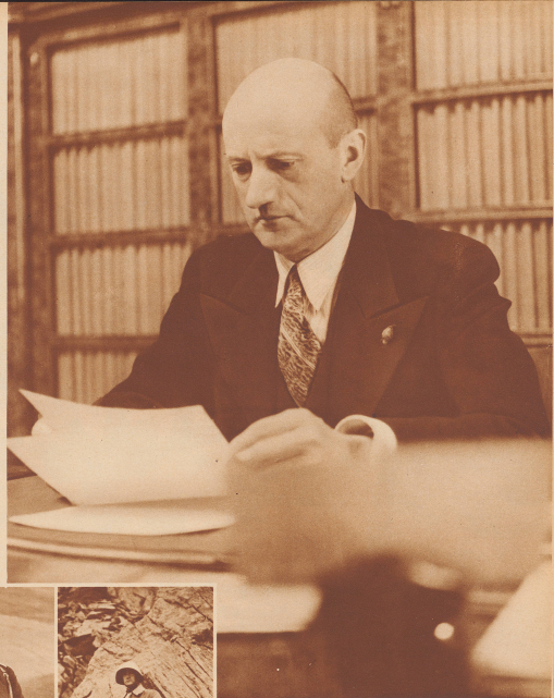
Bundespräsident Etter, Vizepräsident des Departementes des Innern in seinem Arbeitszimmer im Bundeshaus. M. Philipp Etter, président de la Confédération suisse pour 1939.

Mit Bundesrat Philipp Etter, dem 55. Bundesrat seit 1848, gelangt zum erstenmal ein Bürger aus dem Kanton Zug zur höchsten Würde in der Eidgenossenschaft. Philipp Etter ist am 21. Dezember 1891 in seinem Heimatdorf Menzingen geboren. Er studierte die Rechte an der Universität Zürich. Nach Abschluß seiner Studien etablierte er sich 1917 als Rechtsanwalt in Zug. Das erste Amt, das er bekleidete, war das des Verhörrichters. 1918 — mit 27 Jahren — wurde er in den Kantonsrat gewählt, 1922 in den Regierungsrat. 1927/28 war er Landammann. 1930 zog er in die Eidgenössische Ständekammer ein. Seine Wahl in den Bundesrat erfolgte am 27. März 1934, als Nachfolger des zurückgetretenen Dr. J. M. Masay. Er übernahm die Leitung des Departementes des Innern, das er heute noch verwaltet. In der Armee bekleidet Bundesrat Etter — mit 47 Jahren gegenwärtig der jüngste in der Eidgenössischen Exekutive — den Grad eines Majors der Infanterie. Vor kurzer Zeit, anlässlich ihrer Jahreshunderjahrfeier, ernannte ihn die Universität Neuenburg zum Dr. h. c.