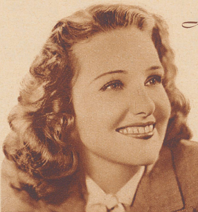
Lola Lane, Star of Warner Bros. Pictures, appearing in "Four Daughters".

Irium in Pepsodent Zahnpaste begeistert Millionen — jeden Morgen erneut — durch das neue blendende Weiss, das es den Zähnen verleiht! Nie zuvor konnte solch strahlender Glanz mit einer so absolut unschädlichen Zahnpaste erzielt werden. Ja, mit IRIUM-haltigen Pepsodent riskieren Sie nichts... keine Möglichkeit, dass Ihr kostbarer Zahnschmelz angegriffen wird.