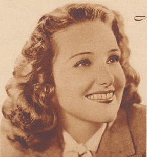
Lola Lane, Star of Warner Bros. Pictures, appearing in "Four Daughters".

Irimum in Pepsodent Zahnpaste begeistert Millionen — jeden Morgen erneut — durch das neue blendende Weiss, das es den Zähnen verleiht! Nie zuvor konnte solch strahlender Glanz mit einer so absolut unschädlichen Zahnpaste erzielt werden. Ja, mit IRIUM-haltiger Pepsodent riskieren Sie nichts... keine Möglichkeit, dass Ihr kostbarer Zahnschmelz angegriffen wird.