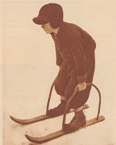
Der Ur-Ur-Großvater des heutigen Kinderski!

Schon vor zweihundert Jahren sind die Kinder Ski gefahren, wenigstens die Buben. Die Skier haben zu jener Zeit allerdings noch anders ausgesehen als heute. Auf dem Bild oben könnt ihr euch davon überzeugen: das ist nämlich ein solcher Ski, auf dem die Kinder vor zweihundert Jahren sich getummelt haben und auf dem man übrigens heute noch sehr gut fahren kann. Aber diese altmodischen Skier, auf denen der Bub seine Künste probiert, haben schon seit Jahren keinen Schnee mehr unter sich gespürt; denn sie werden im Skimuseum in Stockholm aufbewahrt. In Skandinavien ist der Ski ursprünglich ein Verkehrsmittel gewesen, lange bevor er dort und in der ganzen Welt zum Sportgerät wurde. Diejenigen unter euch, die in Bergdörfern wohnen, wissen auch etwas davon zu sagen, wie «gäbig» die Skier sind, um über knietiefen, ungepfadeten Schnee ins Dorf oder ins Schulhaus zu gelangen.