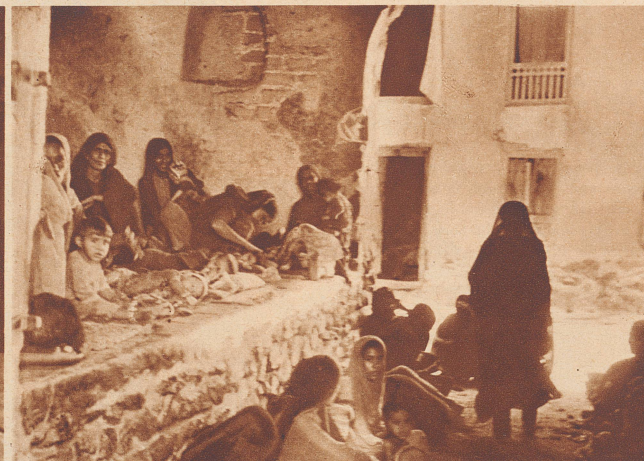
Um sich von der Stubenluft ihrer überfüllten Burg zu erholen, lassen sich die bleichen Frauen im Torbogen nieder, denn in der ganzen indischen Siedlung gibt es keinen Garten, steht kein Baum und kein Grashalm.

Ce n'est pas vivre que de rester enfermé derrière ces grilles en bois par où pénètre une faible lumière.