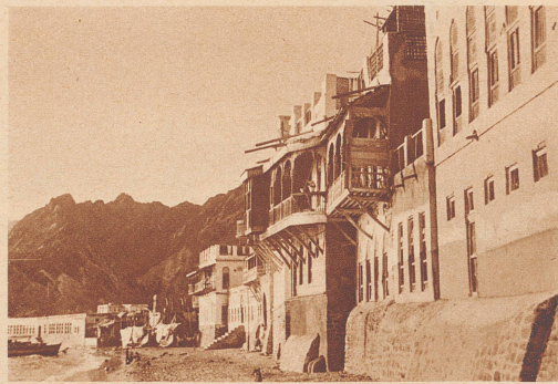
Die Khoja-Burg. Die offenen Balkone der Burg dürfen nur von Männern betreten werden. Die Frauen aber, deren Gemächer auf dieser Seite der Burg liegen, können das Meer nur durch die Holzgitter erblicken. Die Khoja wären reich genug, sich Paläste zu erbauen, aber es ist kein Platz vorhanden. Matrah, zwischen Bergen eingekeilt, umfaßt so eng die indische Siedlung, daß diese keine Möglichkeit zur Ausdehnung hat. Die Häuser links von der Burg sind Bauten des arabischen Stadtteils.

Au milieu de Matrah, petit port de la côte arabe où vont et viennent Bédouins, marins, marchands d'Orient, vit une petite communauté ethnographique distincte de son entourage: les Khoja. Les hommes se mêlent librement à la vie active de la ville; personne cependant ne se vanterait d'en avoir jamais vu une femme. L'interprétation par trop rigoureuse des lois du Coran leur interdit toute sortie. Prisonnières solitaires, derrière un haut mur d'enceinte qui les voit naître et mourir, resserrées dans leurs maisons peu spacieuses, elles mènent une existence sans joie et sans lumière.