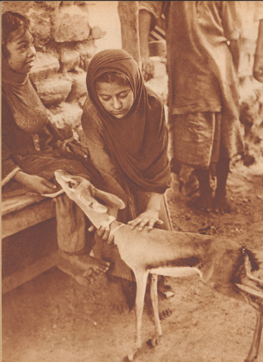
Die beiden Khojamädchen haben eine junge Gazelle zur Spielgefährtin. Sie ist, wie die Frauen selber, eine Gefangene der düsteren Burg.

Chagrin partagé, chagrin adouci. Jenne gazelle qui tient compagnie aux jeunes filles.