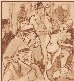
Wenn doch die Vordertür zubliebe, es zieht ja abscheulich ...