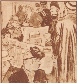
Morgens vor Geschäftsbeginn und noch dazu bei Regenwetter ist die Fahrt im Tram keine reine Freude.

Nach einem ausgezeichneten Mahl nahmen wir herzlich Abschied voneinander. Leider hatte ich nach Kriegsende keine Gelegenheit mehr, den zugesagten Besuch zu machen und ich habe daher zu meinem Bedauern den berühmten Admiral nie wieder gesehen.