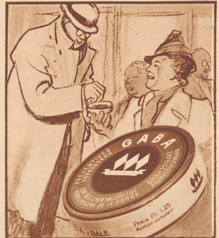
Die Dame bietet ihm aus Dankbarkeit ihre Gaba an. Gaba, als Schutz vor Husten, Heiserkeit und Rachen-Katarrh.

Der sorgfältige, elegante, leistungsfähige Wagen