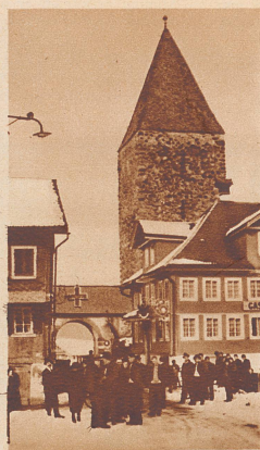
Die Bevölkerung von Rothenthurm steht aller Kälte zum Trotz draußen im Freien und guckt neugierig zu, was denn da eigentlich «gespielt» werden soll.