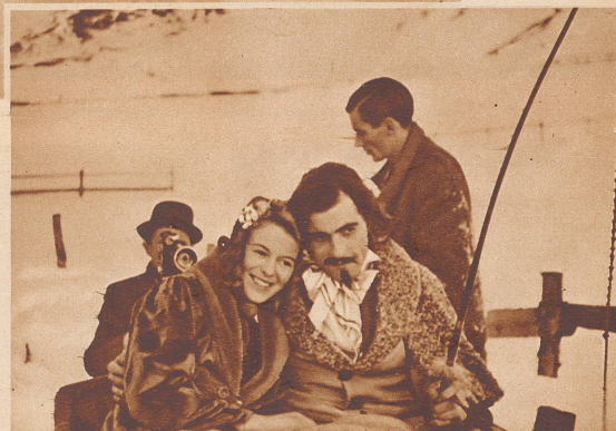
Die Schlusszene. Nettchen und Strapinski glücklich vereint auf dem Schlitten. Im Hintergrund am Aufnahmeapparat der Kameramann Oeschger und stehend der Drehbuchautor und Spielleiter stud. phil. Erwin Kunz.