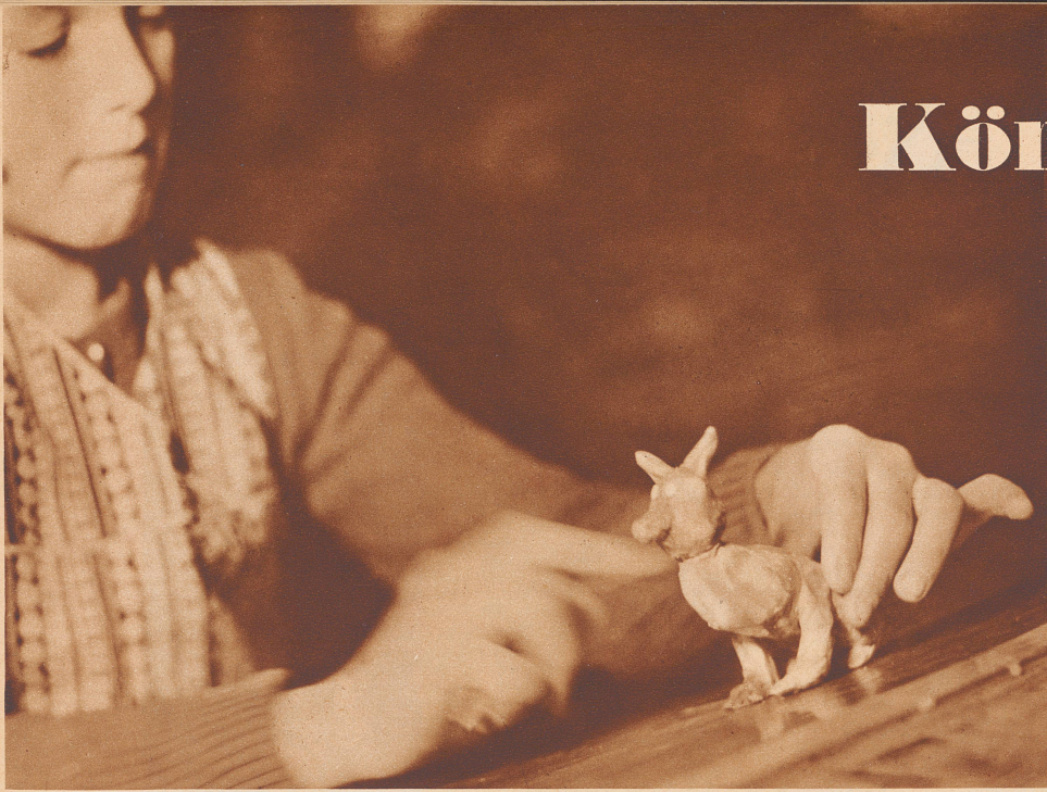
Zeichnen ist nicht Ruthlis Stärke. Fast muß man fürchten, sein Fuchs fliege nächstens auf und davon. Si maître Goupil pouvait contempler l'apparence que lui donne Ruthli, il ne serait pas très flatté.