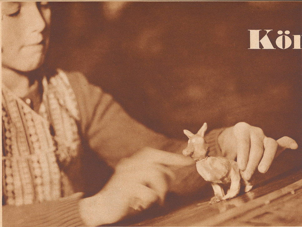
Zeichnen ist nicht Ruthlis Stärke. Fast muß man fürchten, sein Fuchs fliege nächstens auf und davon. Si maître Goupil pouvait contempler l'apparence que lui donne Ruthli, il ne serait pas très flatté.