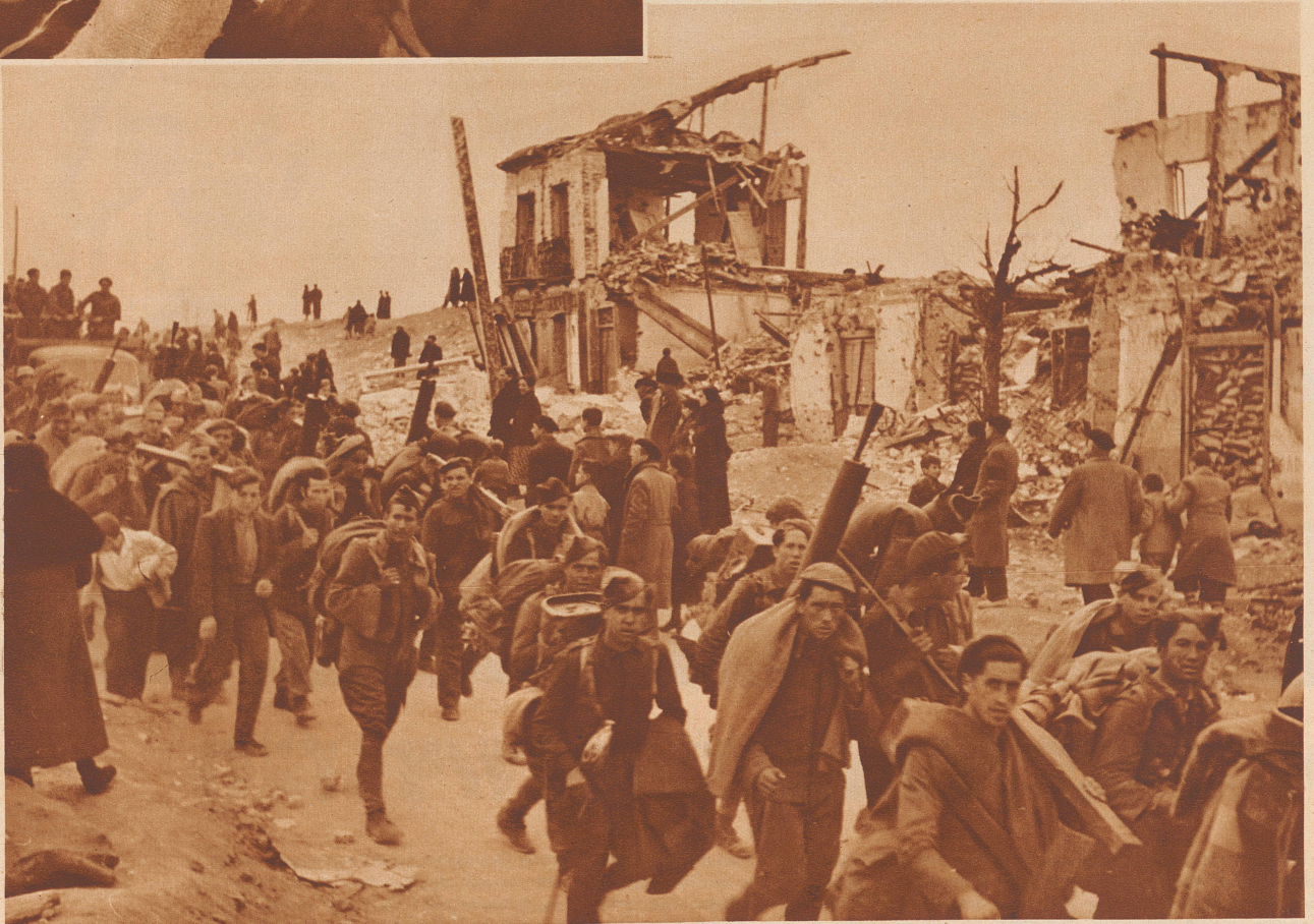
Um die Mittagszeit des 28. März marschierte die erste nationalistische Division von Süden her in die Stadt ein. Es war das Freiwilligenkorps des Generals Saliquet. Bild: Eine Abteilung des besagten Korps auf dem Durchmarsch durch eines der arg zerschossenen Außenquartiere. Marchant en tête des troupes nationalistes, la division Saliquet entre dans Madrid.

Le 28 mars, à 11 heures, le drapeau blanc est hissé sur le bâtiment des téléphones. Après un siège de près de trois ans, Madrid capitulait. Des phalangistes enthousiastes, chargés sur des camions, parcouraient la capitale en acclamant Franco.