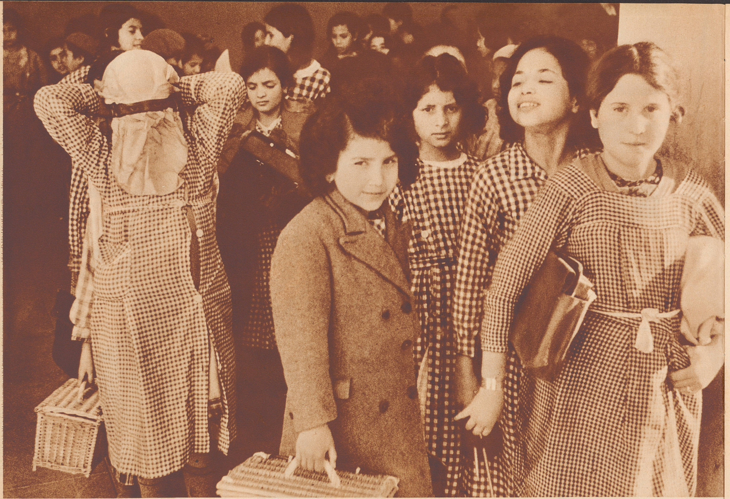
Bevor die Schülerinnen nach Hause gehen, knüpfen sie sich wieder den Schleier vors Gesicht. Wieder werden sie aus munteren Backfischen geheimnisvolle Haremsdamen. Die Schulfädchen zeigen das charakteristische Rassengemisch Tunesiens. Könnte nicht das Mädchen rechts aus der Schweiz stammen? Die maurischen Piraten schleppten die Angehörigen der verschiedensten Staaten auf den tunesischen Sklavenmarkt, von wo aus die Frauen in die Harems wanderten. Viele Tunesier finden in ihrem Stammbaum eine korsische, englische oder französische Urgroßmutter, die Eingeborenen sind nur ihrer Kultur nach, nicht aber blutmäßig arabisch. Elles se voient avant de quitter l'école. Que de différents types présentent les visages de ces écolières. Celle de droite pourrait très bien être Suisse. Il est vrai que le sang d'une arrière grand-mère anglaise, française ou allemande coule peut-être dans ses veines. Les pirates barbaresques qui arraisonnaient en Méditerranée les vaisseaux chrétiens aimaient, il est vrai, à conserver leurs captives à l'ombre des harems!