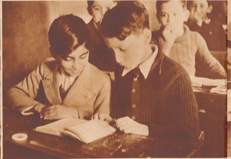
Gleiches Schulprogramm in Tunis wie in Paris. Es gibt zwei Arten Schulen in Tunesien: französische und franco-arabische Schulen. Beide unterstehen dem französischen Unterrichtsdirektor. Für beide ist das Schulpensum vollständig gleich wie in Frankreich. Nur wird in den franco-arabischen Schulen während fünf Stunden pro Woche auch die arabische Sprache und Schrift unterrichtet. Sonst ist auch in ihnen die Unterrichtssprache Französisch. Die meisten Eingeborenenkinder verstehen bei Schulbeginn kein Wort Französisch, und doch wird von der ersten Stunde an Französisch auf sie eingelesen. Deshalb der verwunderte Ausdruck, mit dem der Schüler seinen Lehrer anblickt. Es ist ein wesentlicher Bestandteil der französischen Politik, die französische Sprache zur Umgangssprache des gesamten französischen Kolonialreichs zu machen.