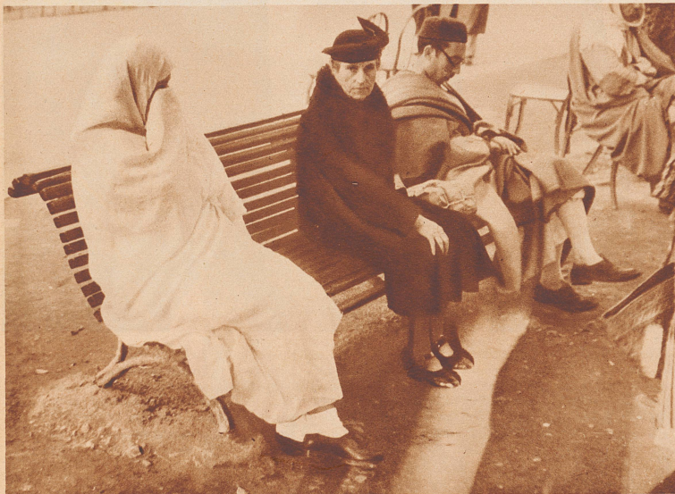
Nachbarschaft auf einer Bank in Tunis

La politique économique de l'Empire. En bordure de la mer où n'étaient, il y a cinquante ans, que steppes désertiques, s'étendent aujourd'hui à perte de vue des plantations d'oliviers. Le capital français et la main-d'œuvre indigène ont collaboré pour ressusciter l'œuvre de la Rome antique. La moitié de ces cultures appartient aux indigènes. Ceux-là, dont les parents jurent gardiens de chameaux, sont propriétaires fonciers et logent dans de coquettes villas.