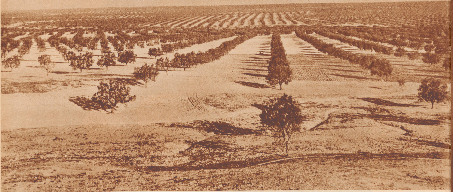
Die Olivenwälder von Sfax