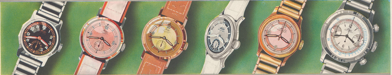
Nr. 8 Stahl, ab Fr. 55.-; mit automatischem Aufzug . . . ab Fr. 70.-

Mido-Multifort: 100% u. dauernd wasserdicht, unmagnetisch, stoßgesichert, unzerbr. Glas, rostfrei, präziz