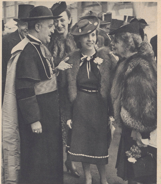
Der apostolische Nuntius in Bern