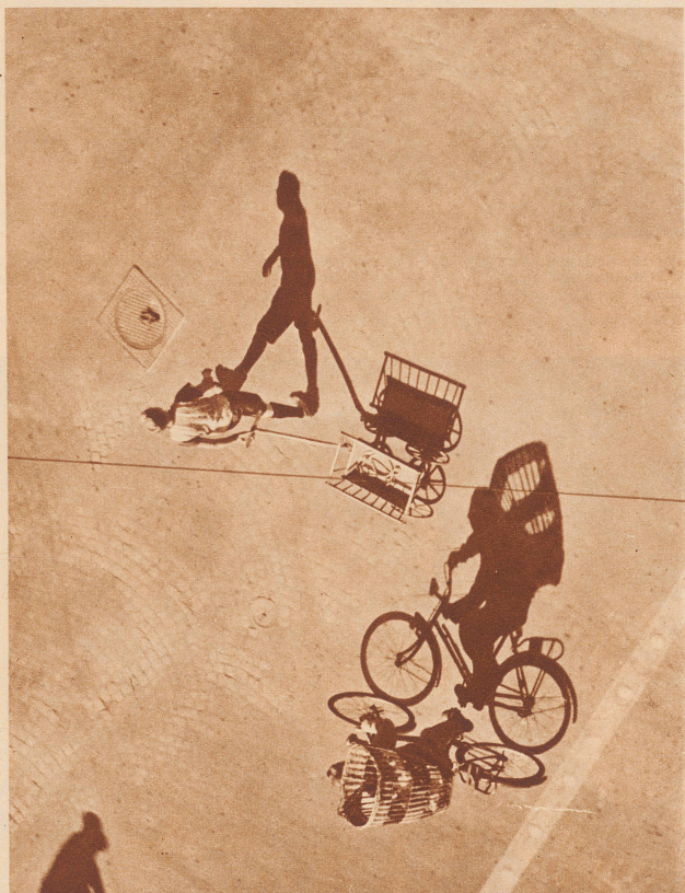
Der Photograph hat nicht aufgepaßt und zum Kummer des Unggle Redakteur die Photo verkehrt in die ZI eingesetzt. Ihr müßt das Blatt nun so lange drehen, bis ihr das Bild richtig seht. Jeux d'ombre.