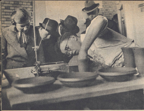
Der Töpfer im keramischen Pavillon der Abteilung Bauen muß bei seinem Handwerk scharf aufpassen, und mitunter müssen sich die Frager gedulden, bis er seine Erklärungen abgeben kann. Er hat im Anfang nur zwei Stunden gebraucht, bis er an das Arbeiten vor dem Publikum gewöhnt war.

«Au bout de deux heures, j'étais habitué au public!» déclare le potier dans la section de la Construction, au pavillon de la Céramique. Aujourd'hui, il ne se laisse plus distraire par des questions... Imprimé.