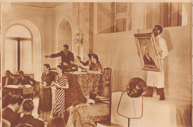
Das größte Ereignis der Auktion in Luzern: van Goghs «Selbstportraits», das für 175 000 Franken dem amerikanischen Kunsthandel zugeführt wurde. Es befand sich vorher in der Staatsgalerie München.