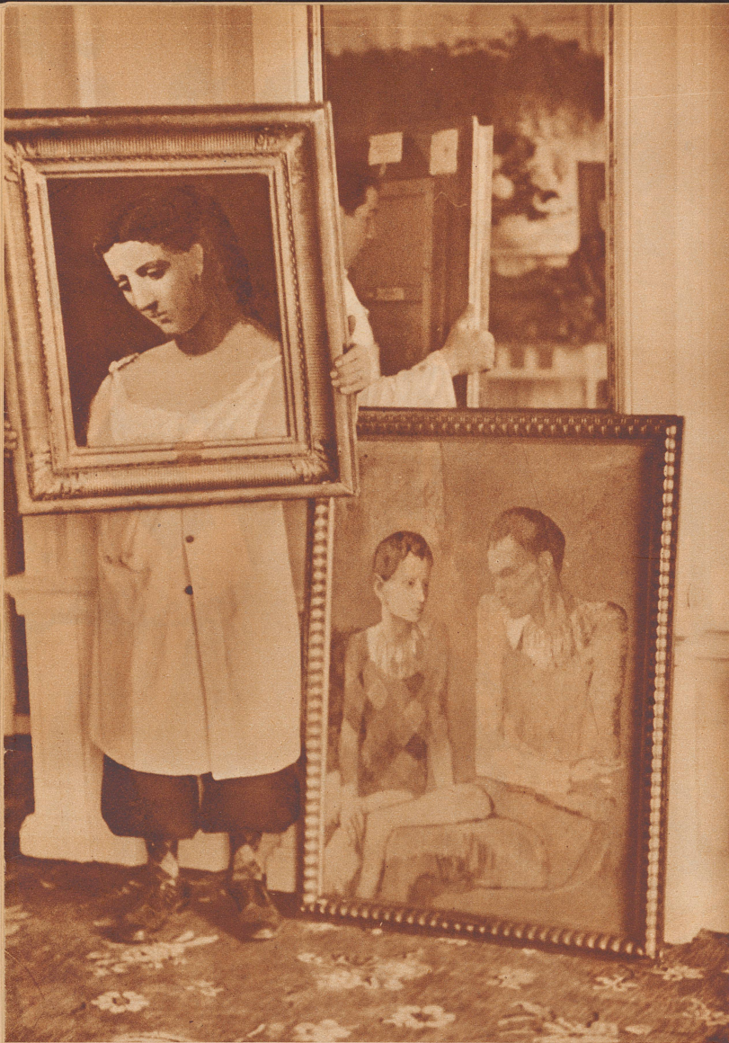
Zwei Gemälde von Pablo Picasso werden ausboten: der «Frauenkopf», der 8000 Franken erzielte, wird möglicherweise in der Schweiz verbleiben. «Zwei Harlekine», ein Werk, um das man sich geradezu riß, fiel um 80 000 Franken dem belgischen Kunstvermögen zu.