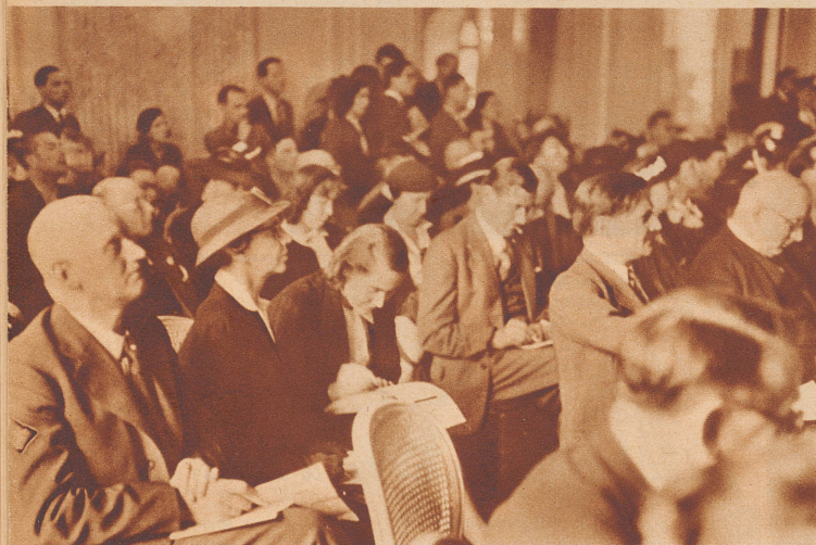
Kunsthändler, Museumsvertreter, Privatsammler, Kunstliebhaber, Presse verfolgen den Fortgang der Versteigerung, die unter anderem Werke von Gauguin, Dix, Nolde, Rohlf, Schmidt-Rottluff, Corinth, Liebermann, Amiet, Lehbruck, Marc, Vlaminck, Barlach ausbot.