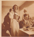
Eine von den hübschen Schweizerinnen im Restaurant des Schweizer Pavillons.