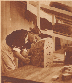
Großer Erfolg im «Swiss-Cheese»-Stand. Die Amerikaner kaufen über die großen Käse. Bis heute sind jede Woche über 5000 Kilogramm verkauft worden.