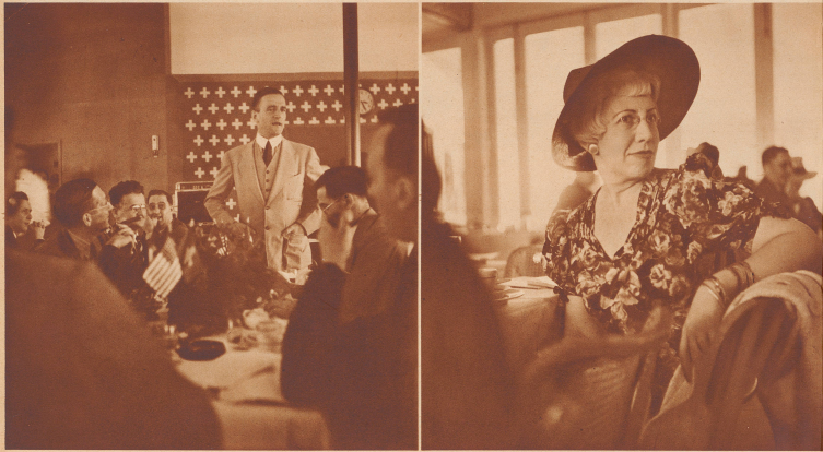
Dr. V. Nef, der Schweizer Generalkonsul in New York und Generalkommissar der Schweizer Abteilung bei der Weltausstellung, spricht beim Bankett im Schweizer Pavillon zu nordamerikanischen Presseleuten.