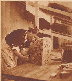
Großer Erfolg im «Swiss-Cheese-Stand». Die Amerikaner staunen über die großen Käse. Bis heute sind jede Woche über 5000 Kilogramm verkauft worden.