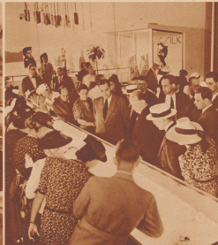
Die amerikanischen Prospektoren vor einem Schaukasten mit Schweizer Souvenirs. Journalisten aus dem ganzen Gebiet der Vereinigten Staaten waren anwesend: aus Kalifornien, aus dem Norden, aus Florida und am zahlreichsten natürlich aus New York selbst. Manche von ihnen werden über 100 Zeilen lang.