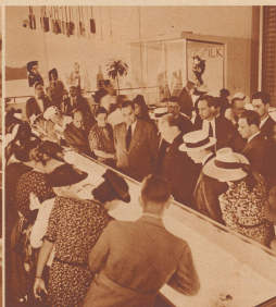
Die amerikanischen Prospektoren vor einem Schaukasten mit Schweizer Sirockwaren. Journalisten aus dem ganzen Gebiet der Vereinigten Staaten waren anwesend: aus Kalifornien, aus dem Norden, aus Florida und am zahlreichsten natürlich aus New York selbst. Manche von ihnen vertrieben über 100 Zeitungen.