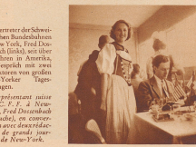
Eine von den hübschen Schweizerinnen im Restaurant des Schweizer Pavillons.