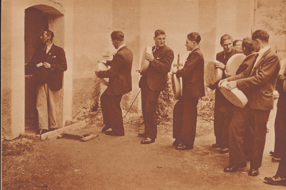
Sennen und Alpmeister des Val d'Anniviers warten vor der Kirche von Vissoie, bis der Augenblick gekommen ist, der es ihnen erlaubt, mit den Käsen zur Segnung in die Kirche einzutreten.