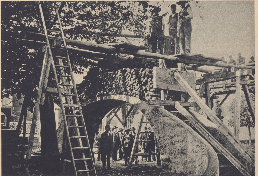
Die Teufelsbrücke der Landesausstellung von 1883. Le pont du diable de l'Exposition nationale de 1883.

A l'entrée de la section «Construire», la plastique du sculpteur Ed. Bick, se dresse entre deux grands murs de briques.