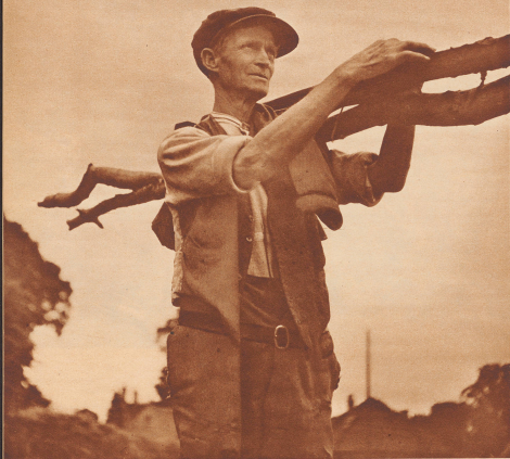
Ein englischer Bauer beim Holzen. Bauern, wie wir sie auf dem Kontinent kennen, gibt es in England nicht mehr. Die englischen Bauern sind Landbesitzer, Pächter, Jagdschützen des Gaudern. Das Ideal der eigenen Scholle kennen sie nicht. Solange es dem englischen Bauern gut geht, trägt er wenig danach, wenn der Grund und Boden gehört. In England ist diese Volksschicht vergrünlicht, und der Begriff des Bauernschichters und Bauernschichten vollständig unbekannt.

Rien de la sorte. Le moralité de paysan anglais est fort différente de celle des paysans d'autres pays. Il ne possède point le sol qu'il cultive, il travaille pour le compte d'autrui, il est fermier, garde-jardinier ou jardineur de nuit et est fier de lui ne pas être plus malheureux. Il ne songe pas à l'émancipation tant que ses affaires sont prospères.