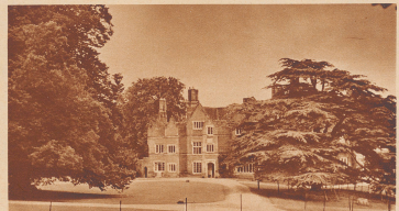
Das ist das aus rohem Backstein gebaute Gut- und Herrenhaus von Greenfield. Hier wohnt der Besitzer des Dorfes. Dieser «landlord» besitzt einige Hektar Land, ihm gehört Haus für Haus, ihm gehört jeder Stein und jede Scheffel Erde. Die Dörfer in England kennen deshalb keine Grundbesitzer und keine Grundbesitzer. Die vornehmen Leute wohnen ganz für sich auf großen Landgütern.

Sur la place du village est demeuré un vieux pilori où l'on enverrait jadis les possesseurs des paysans coupables de méfaits ou malversations.