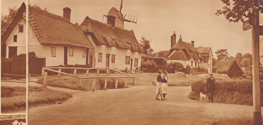
Die Häuser des Dorfes Greenfield in der Grafschaft Essex sind noch mit Stroh bedeckt; die bedekten aber in England keine Scheunen, wo mit ihnen zusammen das mittelalterliche Wohnhausbild und der alte alpenländische Kiefern der Trulimon die Treue halten. Die verbrochene Windmühle erntet einen hohen Schleichobsttag im außer Betrieb. Es ist ein alter Bestandteil geworden, den man nicht mehr braucht, aber man läßt ihn stehen.

On honorerait sans doute le paysan anglais en lui montrant les fermes de l'Angleterre, les domaines féodaux que possèdent nos paysans. Les paysans anglais ne sont presque jamais propriétaires, ils travaillent comme par le passé pour le compte d'un maître et ne comprennent pas à ce point de vue de fait sans que leurs affaires soient prospères et qu'ils puissent, leur travail terminé, recueillir le complément de ce qui ne leur diffère point du bourgeois.