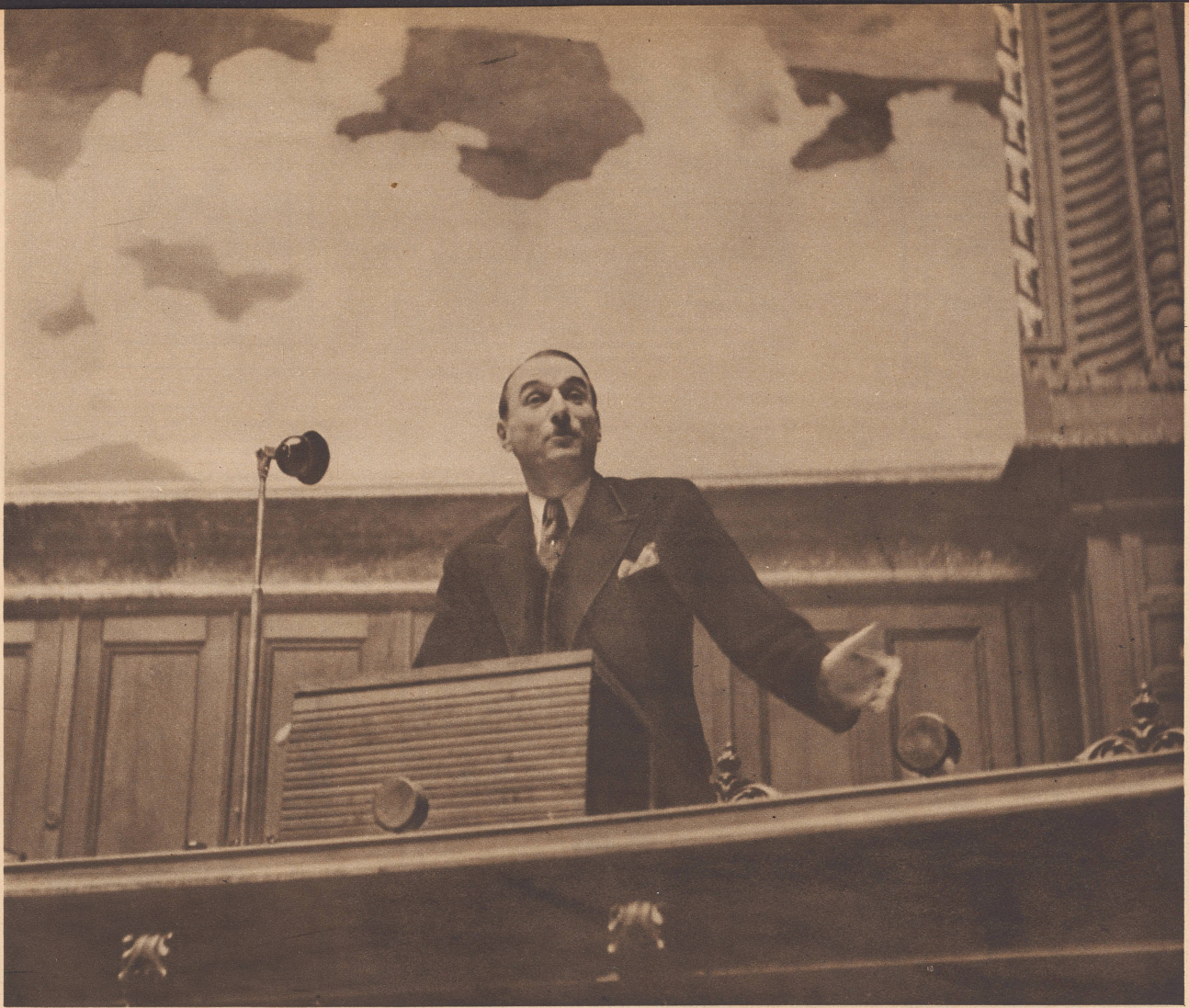
Bundesrat Pilet bei einem Referat im Nationalrat während der vergangenen Dezembersession. Le conseiller fédéral Pilet-Golaz à la tribune. Photo prise lors d'une récente séance du Conseil national.