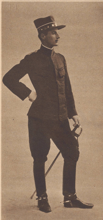
1912. Pilet Marcel, Leutnant in der Rekrutenschule der Fahrennden Mitrailleure in Yverdon. 1912. Pilet, Marcel, lt de mitrailleurs attelés lorsqu'il payait ses galons, à Yverdon.

Deux Vaudois assumeront en l'an de guerre 1940 les responsabilités suprêmes du pays: Le général Guisan et le président de la Confédération Pilet-Golaz. Conseiller national à 36 ans, M. Pilet-Golaz était, trois ans plus tard, appelé à remplacer M. Chuard au Département de l'intérieur. Le nouveau conseiller fédéral n'y demeura qu'une année. En 1929, il succédait à M. Haab au Département des postes et chemins de fer qu'il dirige depuis 10 ans. Président de la Confédération en 1934, c'est donc la seconde fois que M. Pilet-Golaz revêt la plus haute charge du pays. Fait curieux: le jour de son entrée en fonctions coïncidera exactement avec son 50e anniversaire. M. Pilet-Golaz naquit en effet dans la nuit de Sylvestre 1889.