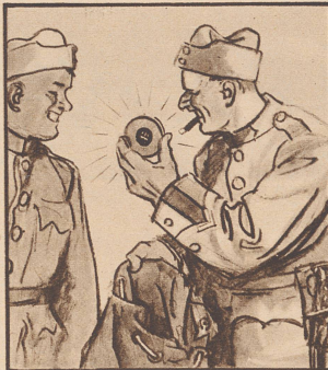
Zum Glück hat die vorsorgliche Gattin auch daran gedacht, und dem „Liebesgabenpaket“ wird immer auch eine grosse Dose Gaba beigelegt.