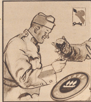
Gaba, auch im Grenzdienst ein gutes Mittel gegen den lästigen Raucher-Katarrh.