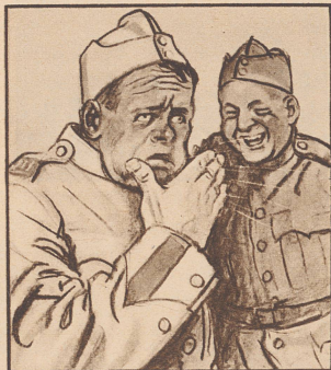
Natürlich spürt man's bald im Hals, und den lästigen Raucher-Katarrh wird man überhaupt nicht mehr los.