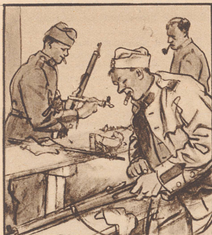
Der Soldat im Grenzdienst ist der reine Immerbrenner; beständig hat er einen Stumpfen im Mund, um wach und munter zu bleiben.