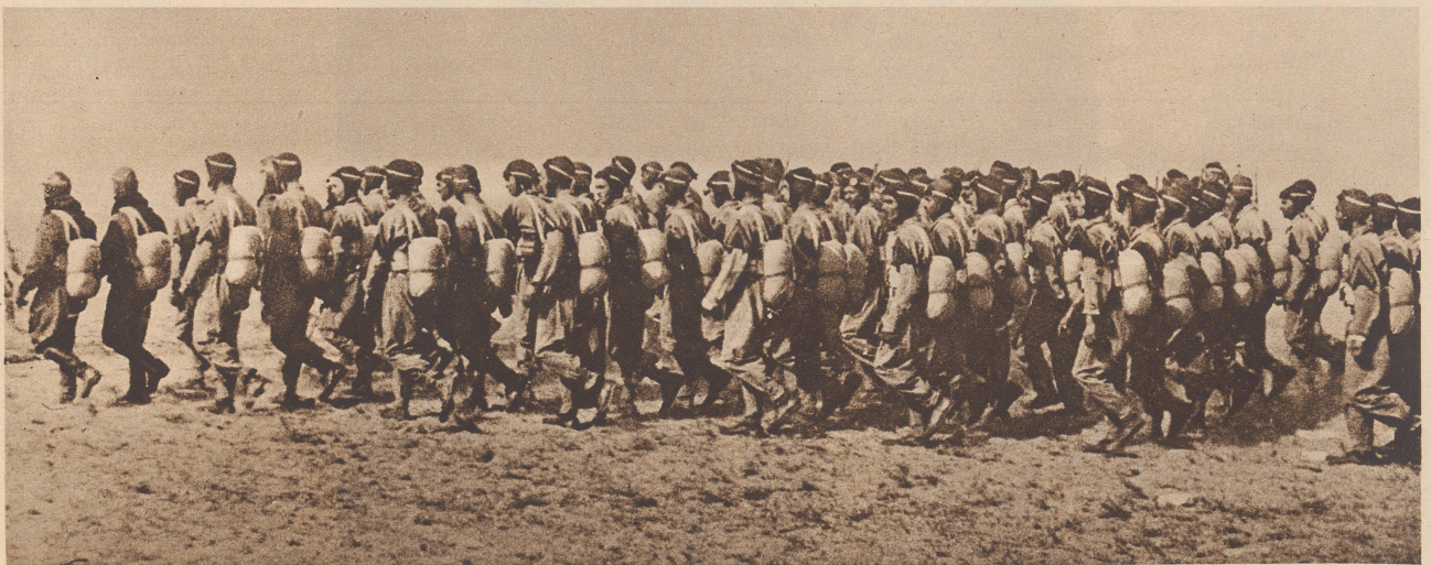
Arabische Fallschirmtruppe auf dem Weg zum Uebungsflugplatz in Italienisch-Libyen. Parachutistes arabes se rendant à leur aérodrome d'exercice en Libye italienne.

Un nouveau film de Charly Chaplin: «Le dictateur». On le voit ici tout embarrassé de la manière dont il doit saluer.