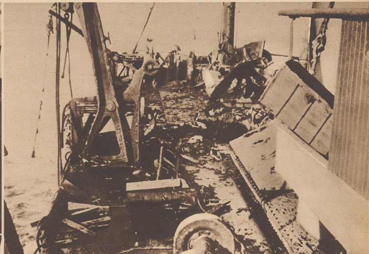
Die Wirkung. Eine deutsche Fliegerbombe traf das Hinterdeck des französischen Frachtdampfers «Reculver». Außer dem schweren Materialschaden gab es einen Toten und 32 Verletzte. L'effet d'une bombe allemande sur la poupe du cargo français «Reculver». En plus des gros dommages matériels, un matelot trouva la mort et 32 furent blessés par le projectile.

Une tâche périlleuse. Voici, à bord d'un poseur de mines anglais chargé de la préparation d'un champ de mines, des centaines de mines marines prêtes à être descendues dans la mer.