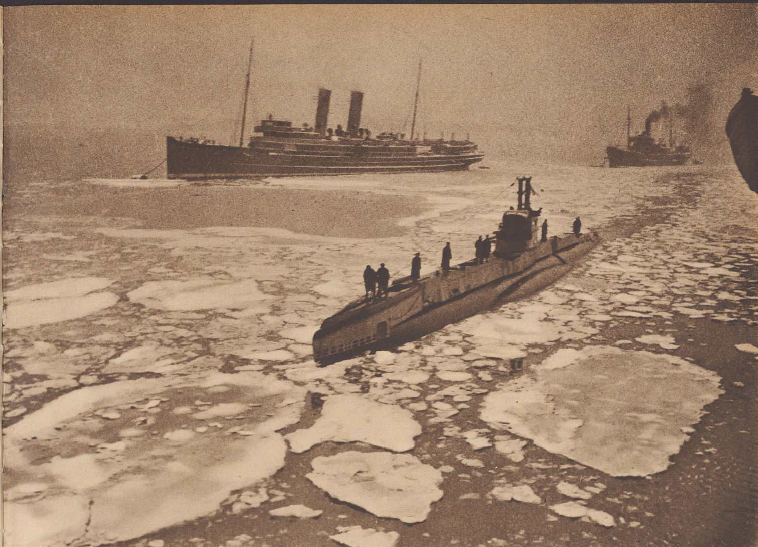
Kühler Empfang. Englisches Unterseeboot kehrt nach mehrtägiger Patrouillenfahrt in den Heimathafen zurück. Als es ausfuhr, war die See spiegelglatt und eisfrei, bei seiner Rückkehr vollzieht sich die Einfahrt in den Hafen bei großer Kälte und etwas behindert von mächtigen Treibeisfladen. Le retour d'un sous-marin anglais après une croisière de reconnaissance qui dura plusieurs jours. A son départ, la mer était calme comme de l'huile, à son retour, il trouve l'entrée du port obstruée par les glaces. On le voit ici se frayant un passage.