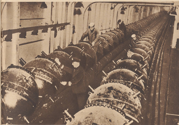
... und aufgereiht wie Perlen an der Schnur! Die Vorräte an Bord eines englischen Minenlegers, der den Auftrag hat, auf See, an einer Stelle vor Englands Küste, ein Sperr-Minenfeld zu legen.

Une tâche périlleuse. Voici, à bord d'un poseur de mines anglais chargé de la préparation d'un champ de mines, des centaines de mines marines prêtes à être descendues dans la mer.