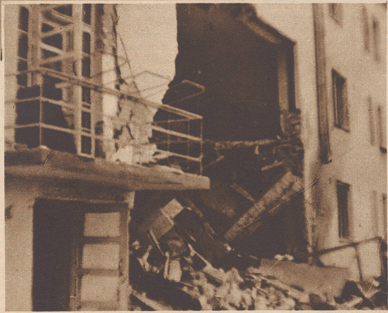
In diesem Hause in einem Dorfe irgendwo hinter der karelischen Front hatte sich eine freiwillige dänische Ambulanz mit Personal, Material und Wagenpark etabliert. Bei einem nächtlichen Bombenangriff auf das Dorf wurde das Haus von einer Bombe so schwer getroffen, daß es geräumt werden mußte. Une ambulance volontaire danoise était venue s'établir dans cette maison à l'arrière du front de Carélie. Pendant un bombardement nocturne, elle fut si gravement atteinte qu'elle dut être évacuée.