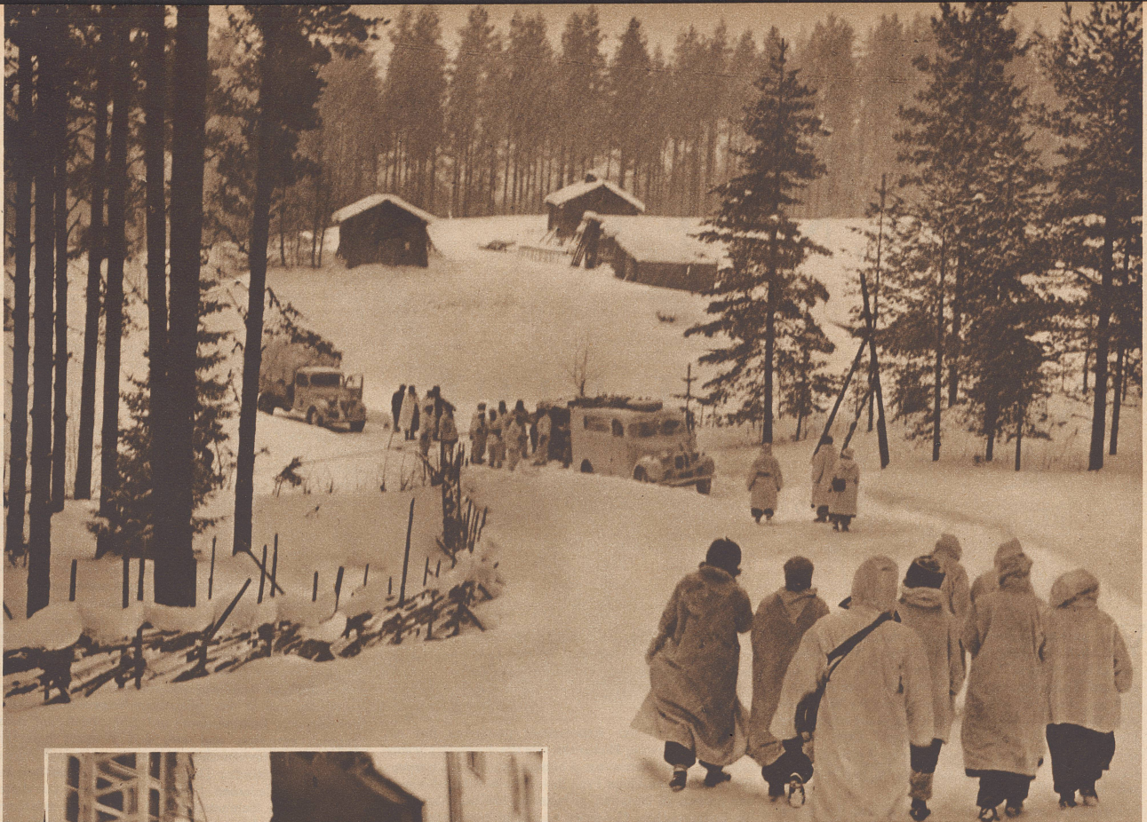
Von der finnischen Heeresleitung bekam die Ambulanz ein anderes Dorf mit neuem Wirkungskreis zugewiesen. Hier sehen wir die Ambulanz auf der Fahrt ins neue Standquartier. L'ambulance a reçu l'ordre de se rendre dans un autre secteur. Nous la voyons ici en route vers l'endroit qui lui a été désigné.