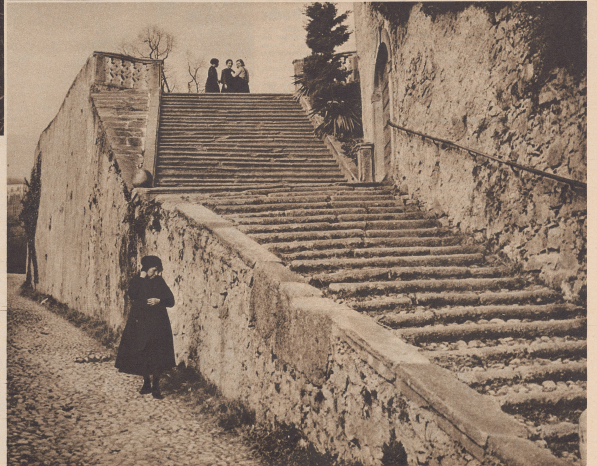
Oberer rechts: Fuhrwerk in der Via Stella von Mendrisio. Im Innern rechts: Ein tobender Pass durch die Via Stella de Mendrisio. Rechts: Die Treppe führt zum Kirchplatz von Salorino. A droite: Escalier qui conduit sur la terrasse de l'église de Salorino.