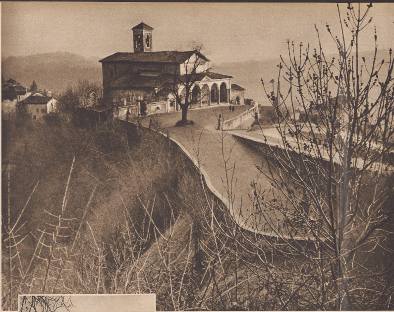
Beim Anbruch, sehen die stierliche Glockentürmechen bescheiden und gebückt den Pfarrhaus auf- gehen zu sein, doch da wir, das Strahlenkreuz fahrend, es von oben erblickten, nahm plötzlich freilichem Anblick seine er gleichsam die Spitze auf! Edele Hiermitte strömte die Kirche von Salorino aus, und wie über ihnen Wasserfälle abwärts, füllte sich wend von Krieglärm und Tageswegen. La petite église de Salorino et sa terrasse vues d'un lacet de la route.