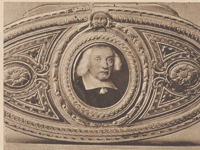
Der Miniaturmaler Jean Petitot (Selbstbildnis) Original im Musée d'Art et d'Histoire, Genève

Und nicht nur das Ihre. Wie oft hatte sie Jean veranlaßt, ihr von seinem Leben zu berichten, das bunt und ereignisreich gewesen war und ihn schon zu hohen Ehren geführt hatte, ehe sie sich noch kennengelernt hatten. Jeans Leben war ihr so vertraut, ihm nachzudenken, es