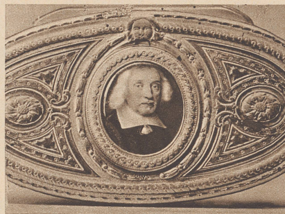
Der Miniaturmaler Jean Petitot (Selbstbildnis) Original im Musée d'Art et d'Histoire, Genève

Und nicht nur das Ihre. Wie oft hatte sie Jean veranlaßt, ihr von seinem Leben zu berichten, das bunt und ereignisreich gewesen war und ihn schon zu hohen Ehren geführt hatte, ehe sie sich noch kennengelernt hatten. Jeans Leben war ihr so vertraut, ihm nachzudenken, es