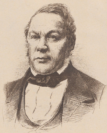
Geh. Rath Dr. J. C. Bluntschli

Fête des Vignerons, à Vevey. Cette grandiose manifestation suscita beaucoup d'intérêt à l'étranger, qui y consacra de nombreux commentaires. Des milliers de participants et de spectateurs y prirent part et le cortège et les ballets remportèrent un énorme succès, d'autant plus appréciable, lorsqu'on songe que les moyens de locomotion de cette époque, étaient loin d'atteindre le confort et la rapidité de nos transports modernes. Le dessin que nous voyons ci-dessus représente la danse de la noce, à la rue du Lac. 1927 nous a permis de revivre cette fête des vigneron qui a eu lieu deux fois entre 1865 et 1927.